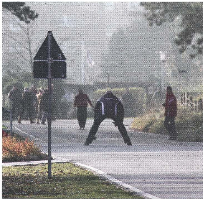
Die Boßler sind nicht nur auf den Straßen am Wochenende zu sehen, sondern gleichfalls zu hören.

Die ersatzgeschwächten Siedlunger, denen sechs Stammwerfer fehlten, schaff-