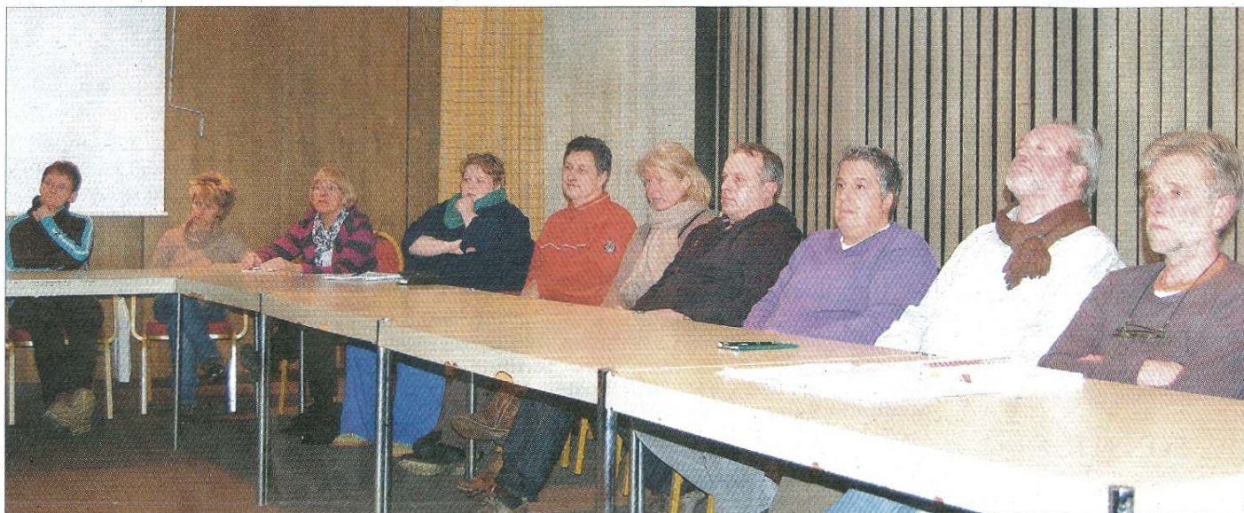
Bereits 30 Vereine haben sich für die Mitgestaltung des Bürgerfests angemeldet.

„Das Bürgerfest bietet den Vereinen und Gruppierungen die Möglichkeit, ihre Arbeit öffentlich darzustellen. Ziel ist es jedoch, die Sozialgemeinde Norderney für einen Tag zusammenzubringen“, erklärte Aldegarmann. Zum gemeinsamen Feiern gehöre selbstverständlich auch die Bewirtung. Hier habe man laut Vorsitzendem bereits den Einzelhandelsverband sowie Hotel- und Gaststättenverband angeschrieben. „Das Fest soll keine kommerzielle Veranstaltung werden,