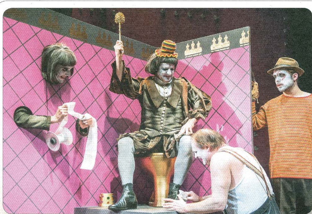
Tip der Woche: Die Landesbühne Niedersachsen Nord führt am Dienstag, 22. Januar, um 19.30 Uhr das Stück „Ubu, König“ im Kurtheater auf. Der Eintrittspreis liegt zwischen 18 und 22 Euro.