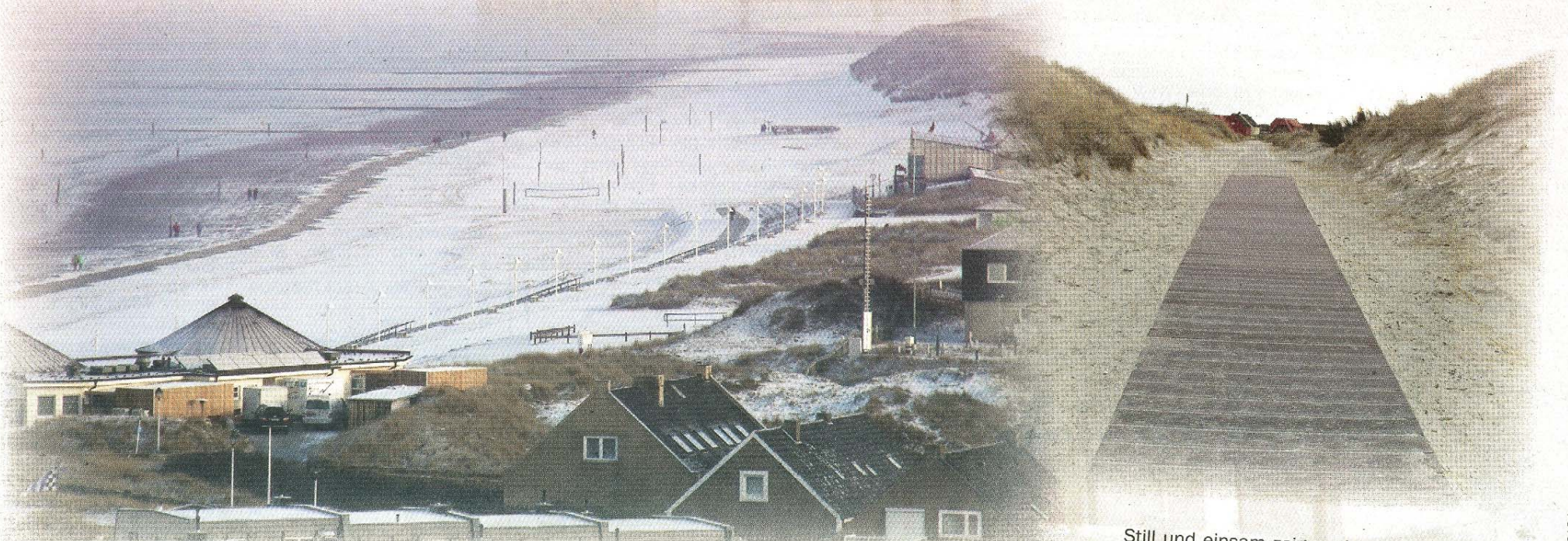
Insulaner und Gäste genießen die Spaziergänge in herrlicher Winterlandschaft am windstillen Strand.