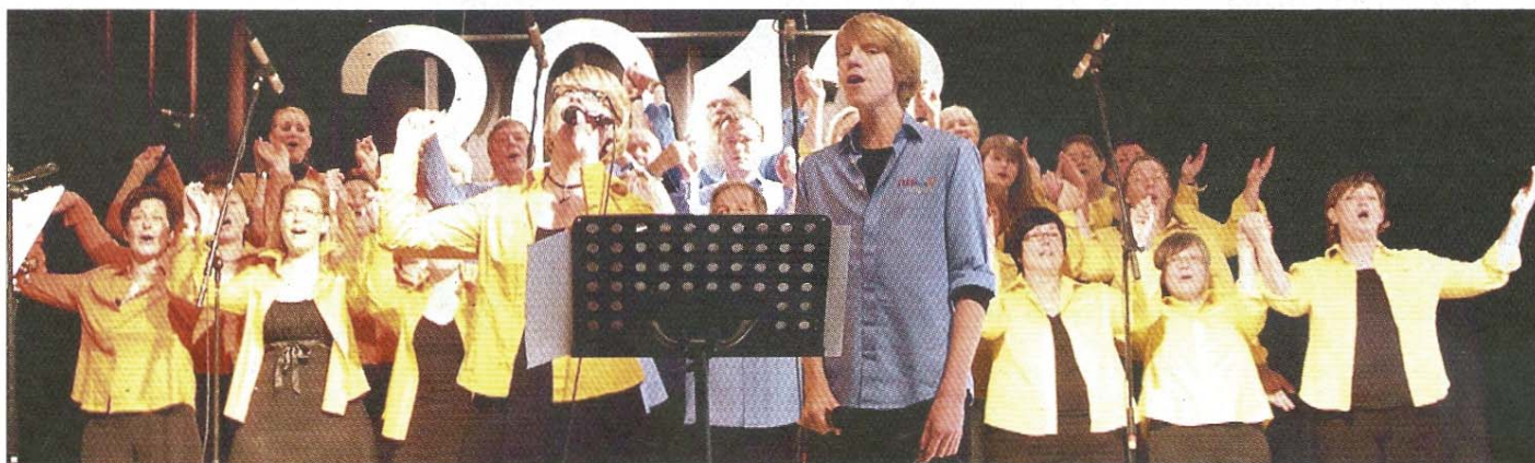
Die „Starfish Singers“ brachten mit ihren beschwingten Gospels ordentlich Stimmung in den Saal des Conversationshauses.