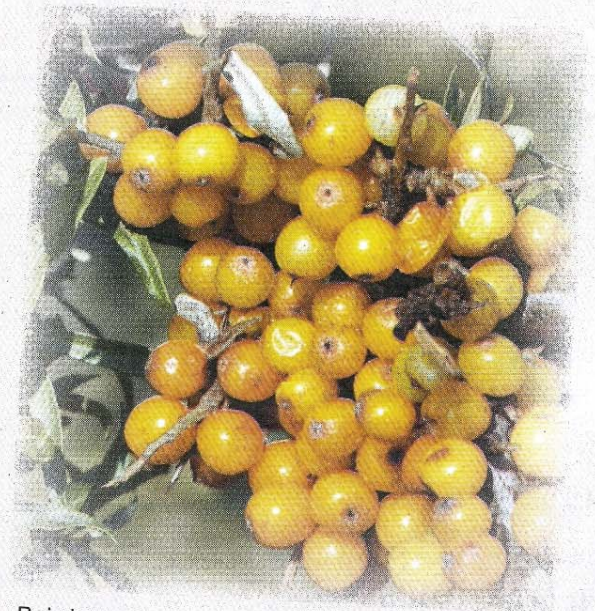
Bei dem nasskalten Wetter lauern Erkältungen. Sanddorn stärkt die Abwehrkräfte.

Gegen feuchtkalte Luft, die einem unter den Pullover kriecht, hilft ein gemütliches Feuer – am besten in guter Gesellschaft.