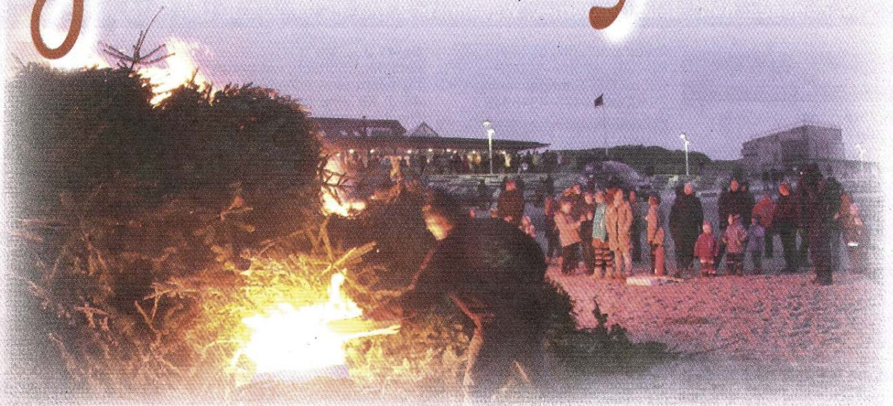
Für den Müll sind die ausgedienten Weihnachtsbäume wahrlich zu schade. Am Nordstrand haben die Tannen kürzlich als wärmender Anziehungspunkt gedient. Bei heißen Getränken und guten Gesprächen wurde es so richtig heimelig.

Nicht selten löst der Winter auch Fernweh aus. Wer kann, schwärmt in sonligere Gefilde aus – oder dahin, wo „richtiger“ Winter mit viel Schnee herrscht.