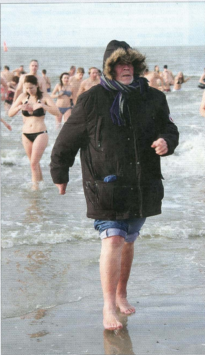
Ein Fußbad tut's ja auch.