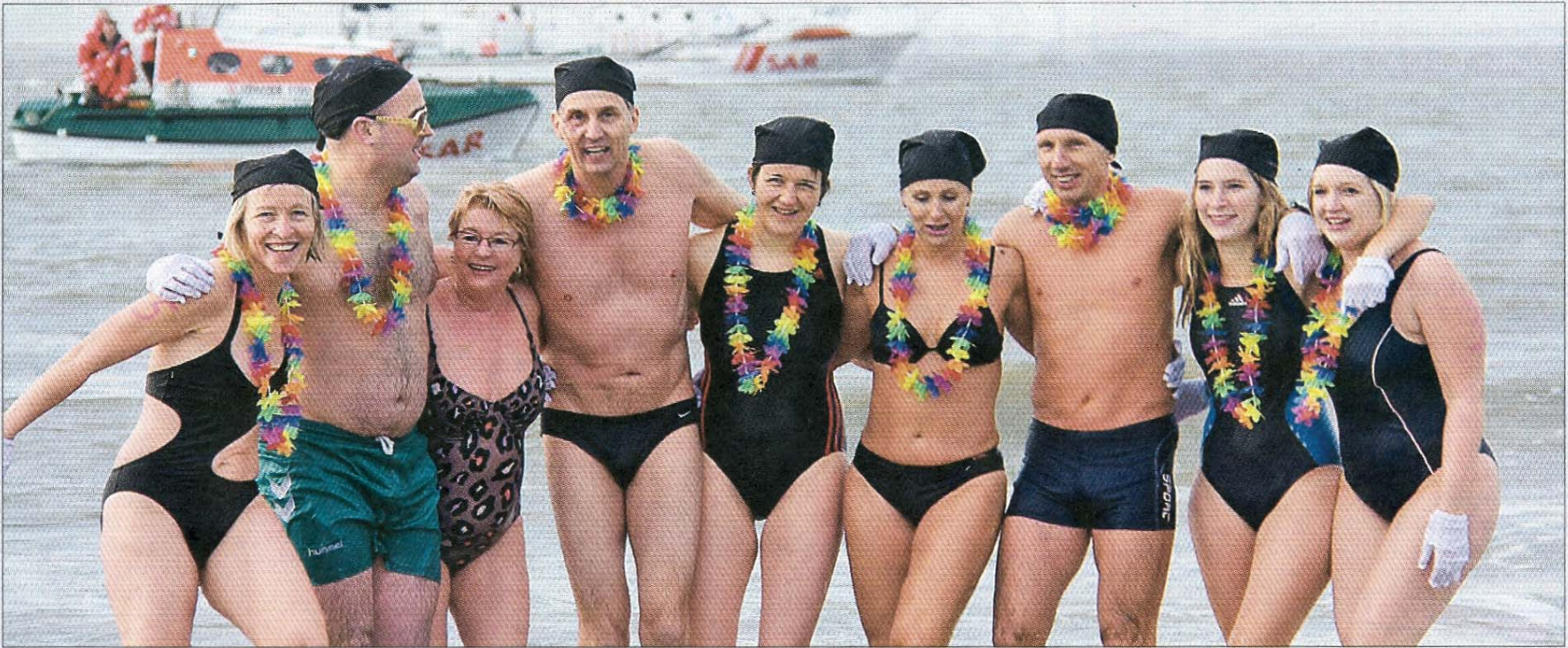
Gut gelaut und bunt geschmückt der kalten Nordsee trotzen.