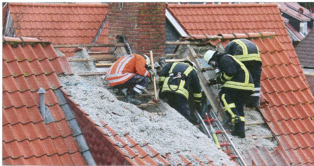
Mit schwerem Atemschutz ging die Feuerwehr vor, um den Dachstuhlbrand in der Nordhelmsiedlung zu löschen.

NORDERNEY – Aufregung am Neujahrsmorgen bei einem Feuer auf Norderney. Gegen 9.30 Uhr wurde die Feuerwehr zu einem Schornsteinbrand alarmiert. Beim Erkunden vor Ort wurde festgestellt, dass es zu einem Dachstuhlbrand in der ökologischen Isolierung eines Wohnhauses in der Nordhelmsiedlung gekommen war. Um an den Brandherd heranzukommen, mussten zunächst Teile des Dachs und der Isolierung entfernt werden. Ein Trupp löste die Wandflächen von innen und löschte erste Glutnester, der zweite öffnete die Dachhaut von außen. Hier kam auch die Drehleiter zum Einsatz. Die Bewohner des Hauses hatten