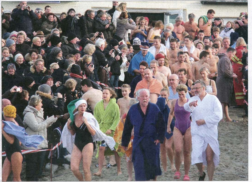
Einmarsch der Gladiatoren am Westbadestrand.