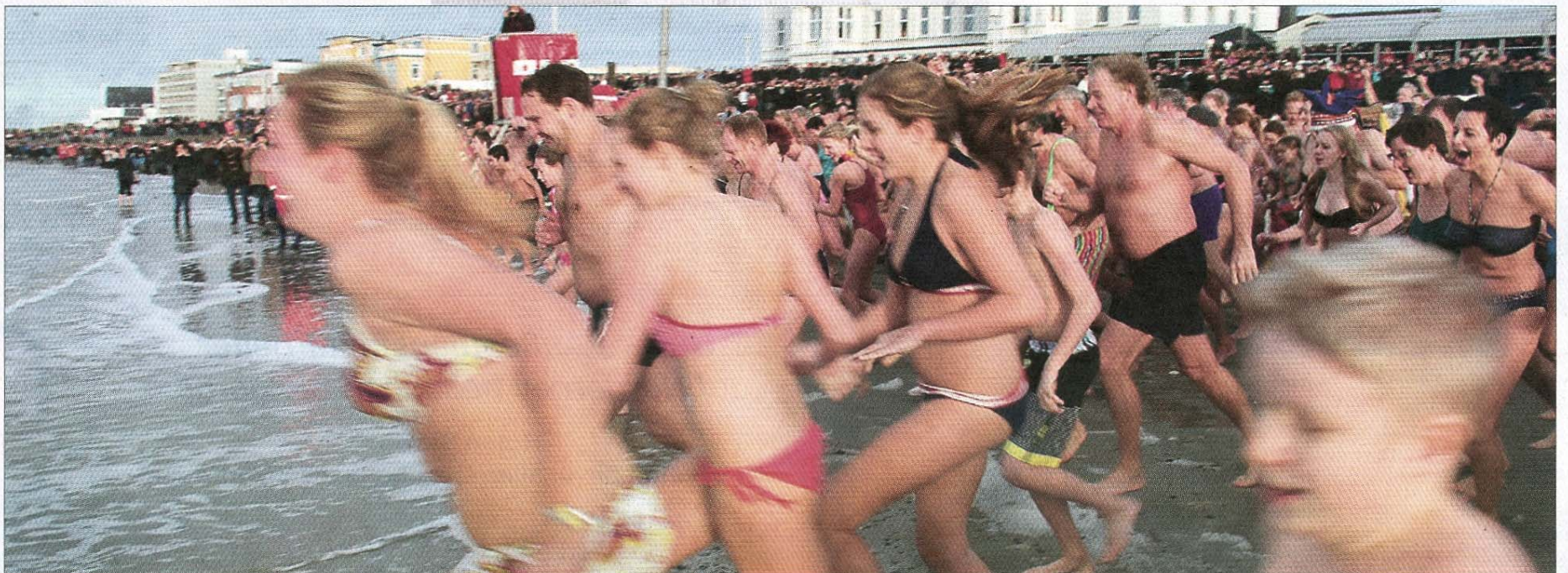
Schnell hinein ins kühle Nass.