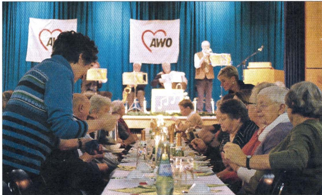
In gemütlicher Atmosphäre fand an Silvester die „Olljoahrsoventfier“ statt.

Das neue Nationalpark-Haus sowie die Umgestaltung