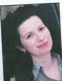
Ilka Arends ☎ 0 49 31 / 925-161

Erhältlich im Buchhandel oder direkt bei Soltau-Kurier-Norden • Stellmacherstraße 14 • Norden SKN-Kundenzentrum • Neuer Weg 33 • Norden sowie in der Verlagsgeschäftsstelle Ostfriesischer Kurier • Wilhelmstraße 2 • Norderney Telefon: 0 49 31 / 925-174 • Fax: 0 49 31 / 925-168 E-Mail: verlag@skn.info • www.skn.info • www.buchshop.skn.info