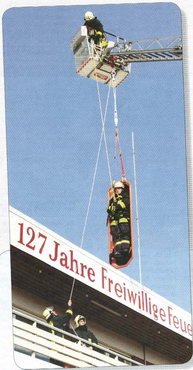
Spektakulär: Rettung mit der Drehleiter.