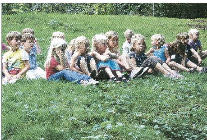
Einige Kinder des Kirchen-Kinderchores.

72 Arten verschwänden von dieser Welt. Pro Tag. Elendsbilder von Mastanlagen, von Tiertransporten und Massentierhaltung wurden aufgezeigt. Die Bitte lautete, dass Gott uns erhören möge, dass wir unser Unrecht erkennen und beseitigen mögen. Dass allen, die ein Unrechtsbewusstsein und den Mut zu Konsequenzen haben, die sogar mit ihrem Leben dafür einstehen wollen, Güte und Gerechtigkeit widerfahren.