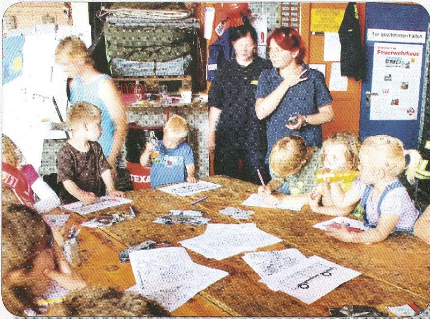
Auch die Kinder hatten gute Unterhaltung.