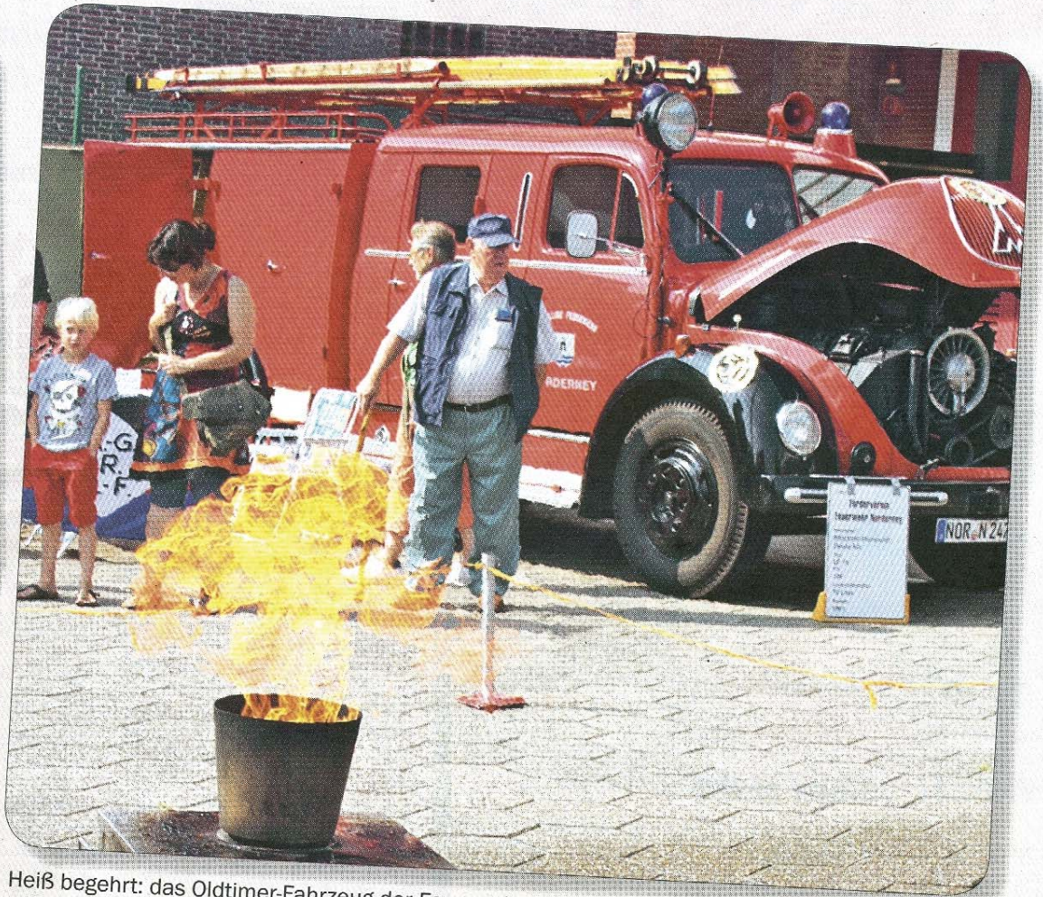
Heiß begehrt: das Oldtimer-Fahrzeug der Feuerwehr Norderney.