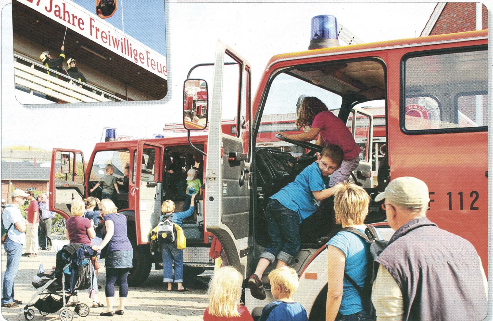
Munter ging es zu beim Tag der offenen Tür.