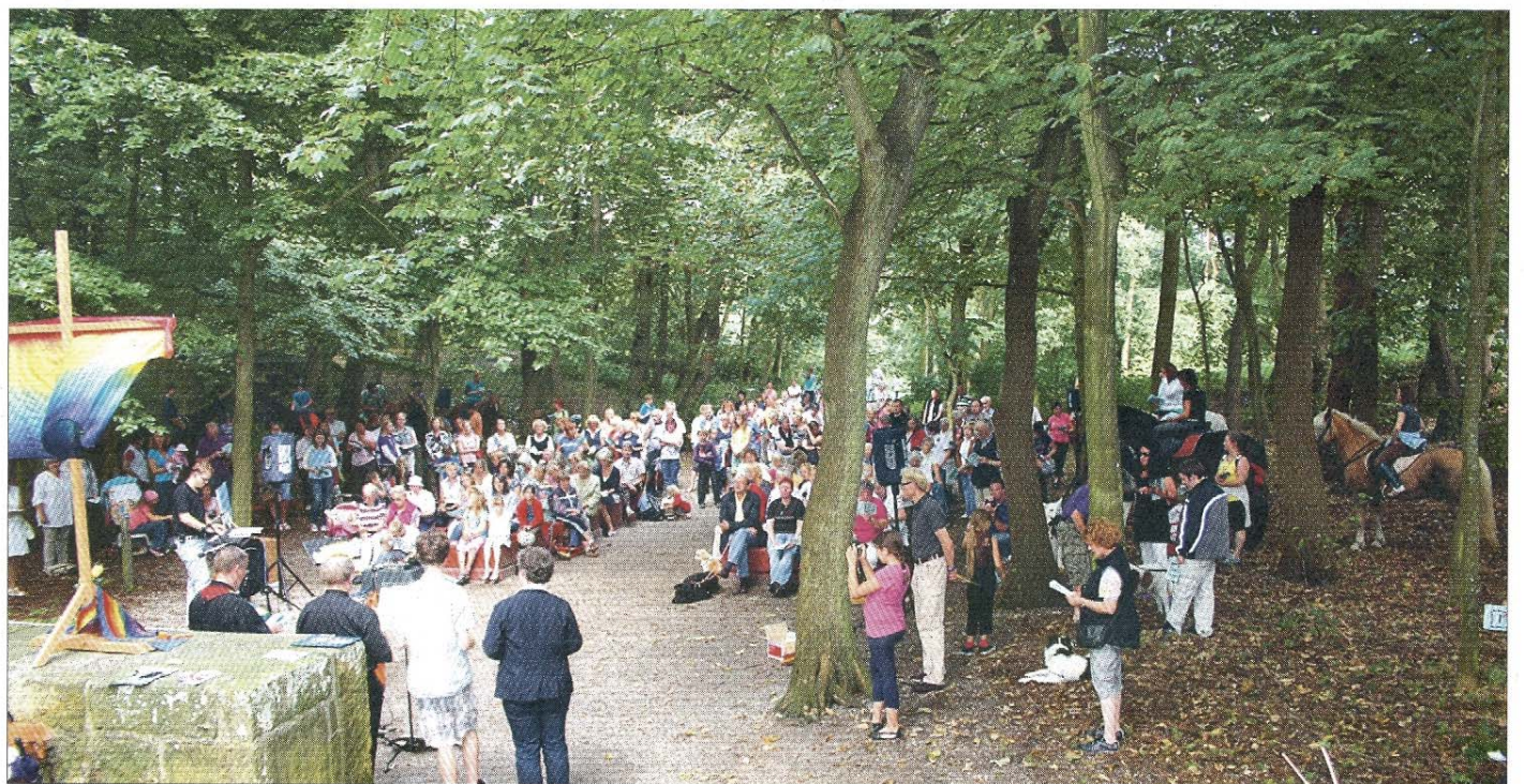
Über einhundert Menschen kamen teilweise mit tierischer Begleitung zum Gottesdienst in die Waldkirche.

„Zum Auftrag der Kirche gehört es, den Mund aufzutun für die Stummen und für die Sache aller, die verlassen sind. Zu diesen gehören auch Tiere“, heißt es dazu auch in den Texten der Evangelischen Kirche in Deutschland (EKD), „Zur Verantwortung des Menschen für das Tier als Mitgeschöpf, 1993). In einem „Handout“, das vor dem Waldgottesdienst verteilt wurde, standen Lieder und Zitate zum Thema Tiere als Mitgeschöpfe. Die eindringliche Botschaft, dass wir für sie Verantwortung übernehmen