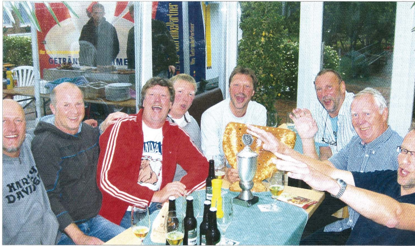
So seh'n Sieger aus: Die Beachhandballer des TuS Norderney feiern ihren unfassbaren Triumph auf Borkum.

SPORT Norderney II siegt beim Insel-Beachhandballturnier auf Borkum