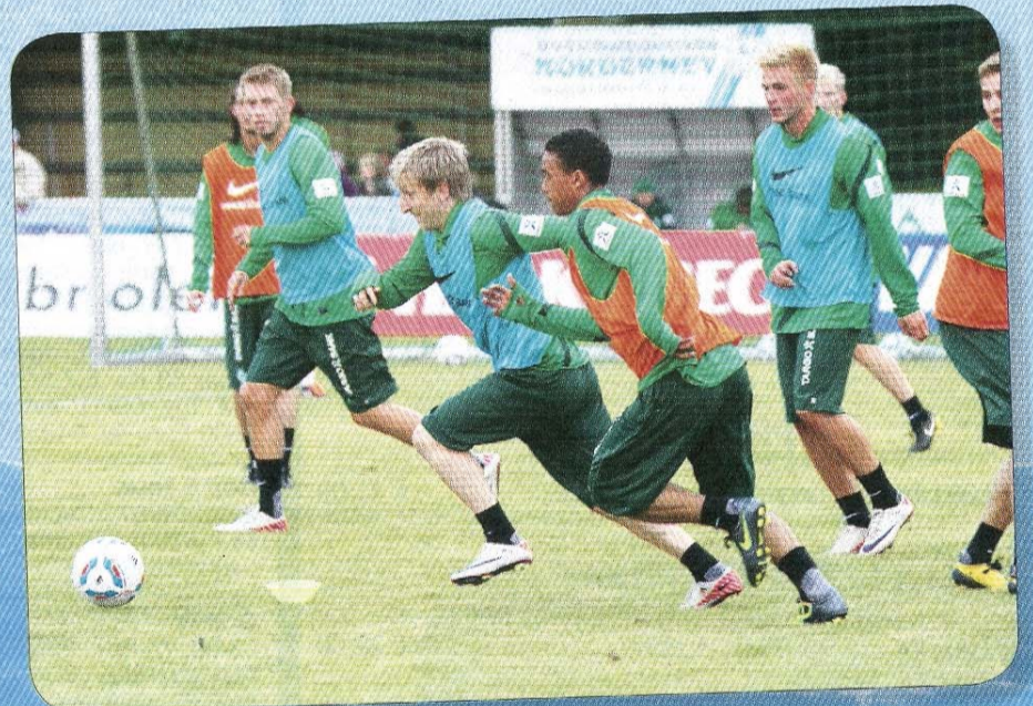
Und wieder Marin. äußerst agil.