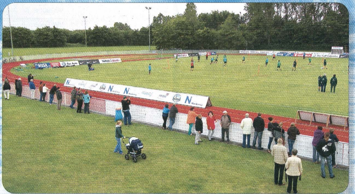
Die Kulisse auf Norderney am ersten Trainingstag.