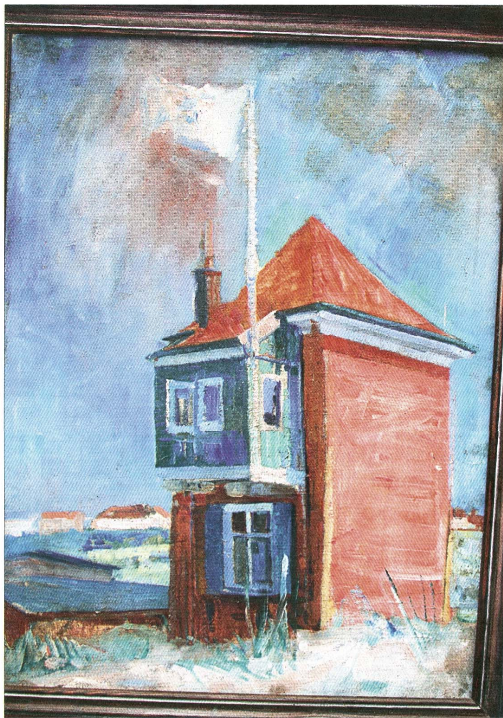
Der Malerturm auf der Sanddüne am Weststrand.

Am 31. Dezember 1949 stirbt Poppe Folkerts und tritt seine letzte Fahrt in See an. Mit einer feierlichen Seebe-stattung wird er dem Meer übergeben. Neben seiner künstlerischen Tätigkeit engagierte sich Poppe Folkerts auch für die Belange der Insel. 1925/26 gründete er den Seglerverein und den Heimatverein. 1928 entwarf Folkerts das Wappen Norderneys mit dem Kap auf der Düne und die schwarz-blau-weiße Norderney-Flagge. Poppe Folkerts hat