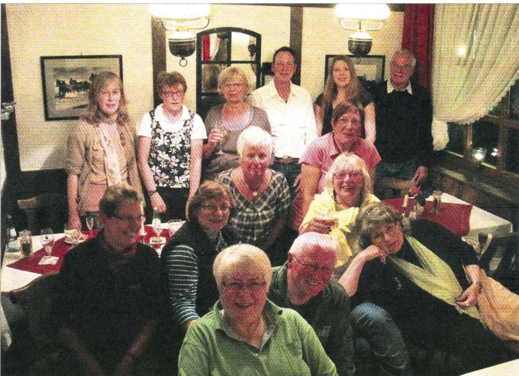
Hochzufrieden mit dem Filmfest 2011: die Norderneyer Filmfestivalfreunde.