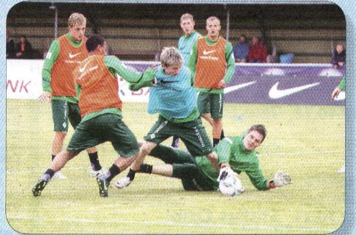
Marko Marin kämpferisch.