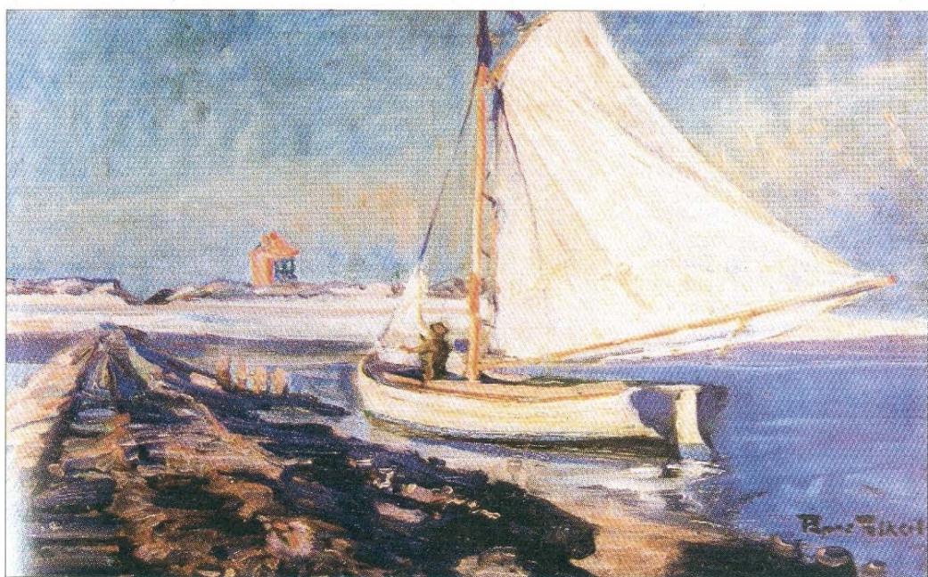
Das Poppe-Folkerts-Segelboot „Friedel“ am Weststrand vor dem Malerturm.

der Inselgemeinschaft wohl dadurch auch ihre Identität verliehen. Übrigens: Die Bezeichnung Flagge wurde um 1600 aus dem Niederländischen übernommen (vlag) und bedeutet Schiffsfahne.