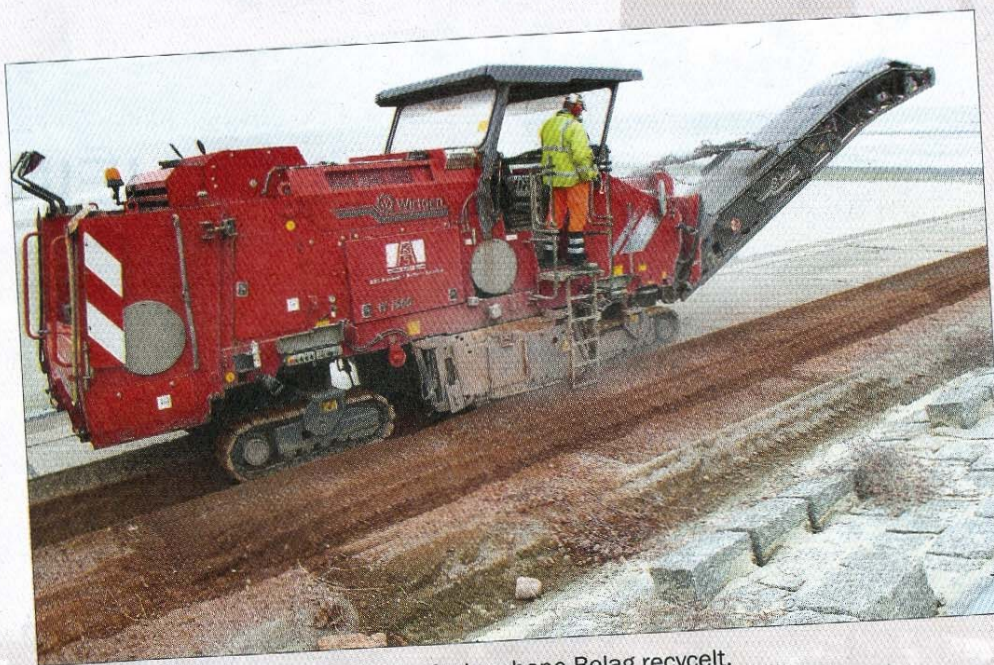
Mit diesem „Monstrum“ wird der aufgebrochene Belag recycelt.