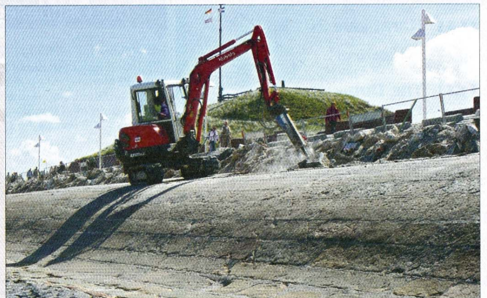
Arbeiten unter schwierigen Bedingungen am Januskopf.