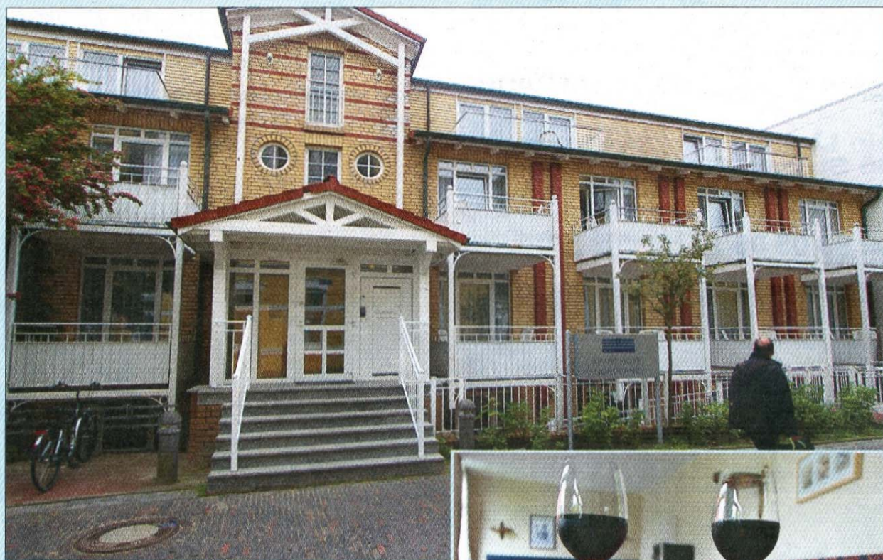
Das Hanseatic-Hotel auf Norderney: Nach umfangreicher Renovierung steht die gastliche Einrichtung, die zum Verbund der Michels-Gruppe gehört, mit einem äußerst gepflegten Ambiente und einem perfekten Angebot für die Gäste bereit.