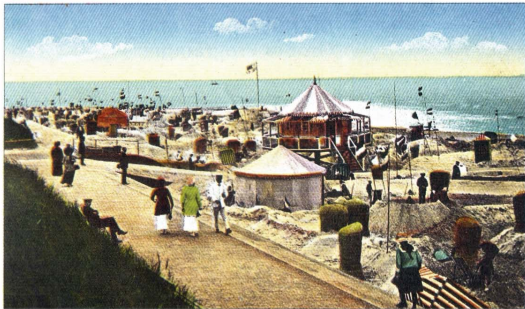
Am Weststrand um 1900. Viele Fähnchen flattern im Wind. Der Bau von Strandburgen war damals ein „Muss“. Heute ist es aus Küstenschutzgründen verboten.

Ob es gelingt, zum Erhalt der Liegenschaft einen Rettungsschirm aufzuspannen oder, wie derzeit alles auf Norderney, ob es der Vermarktung auf dem lukrativen Immobilienmarkt zugeführt wird – wer weiß es?