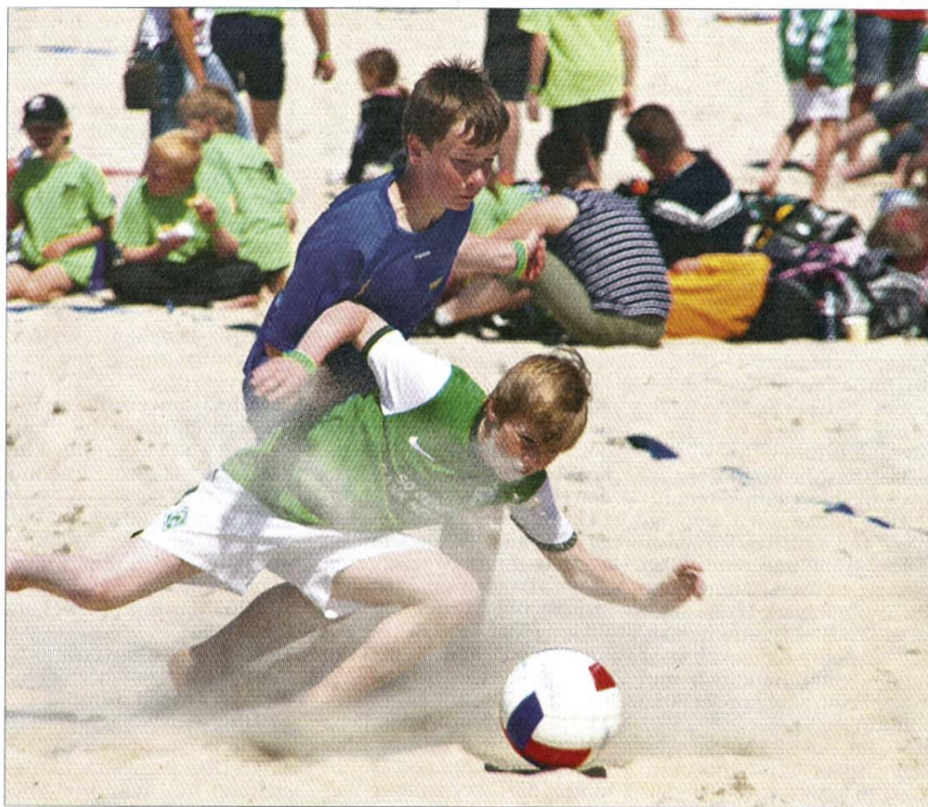
Sand schlucken. Intensive Zweikämpfe fordern ihren Tribut – und machen Spaß.