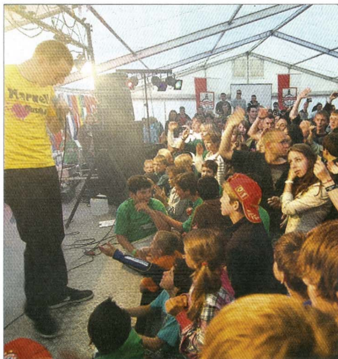
Das Leben nach dem Fußball. Auf die jungen Kicker wartet auch ein flottes Rahmenprogramm.