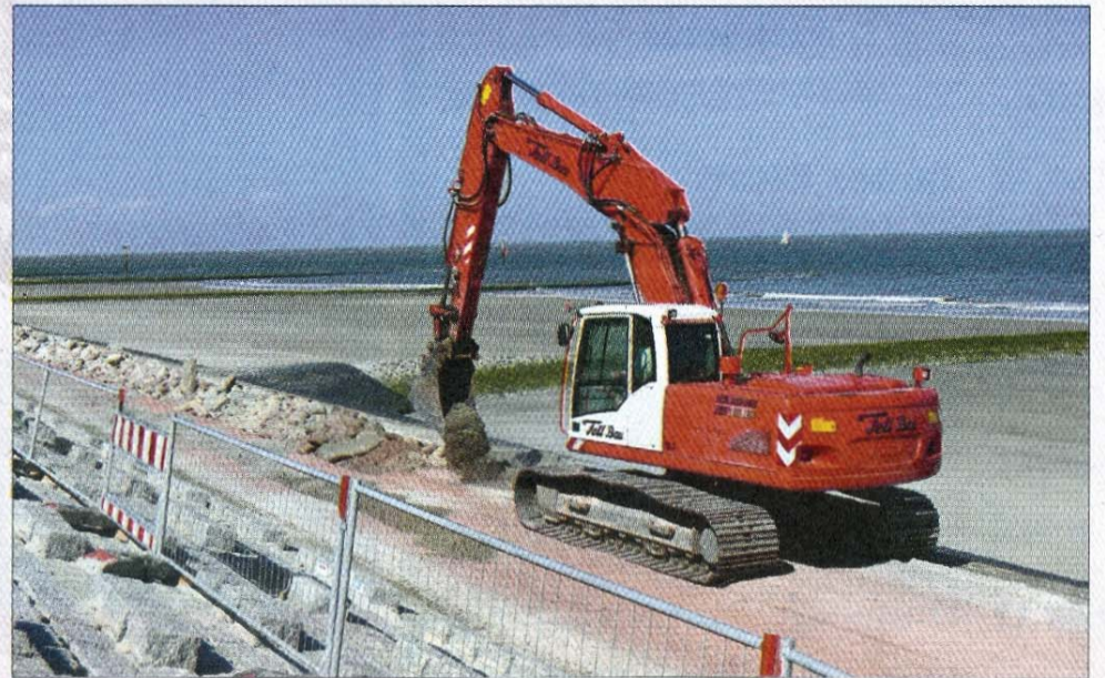
Mit schwerem Gerät geht es auf der Promenade zur Sache.