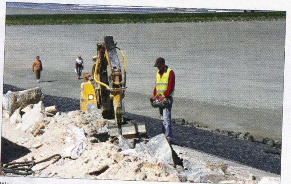
Wenn es enger wird, steht dieser ferngelenkte Mini-Bagger zur Verfügung.