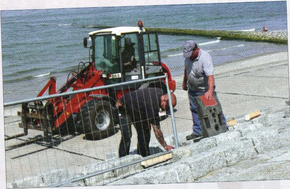
Es geht los. Das Areal der zukünftigen Baustelle wird eingezäunt.