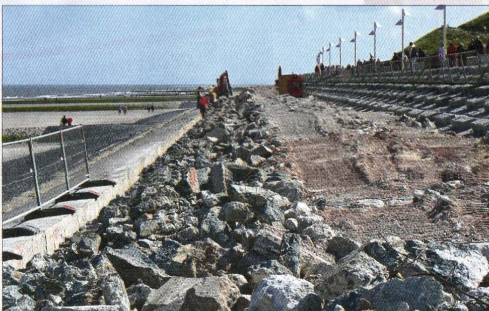
Ein ungewöhnlicher Anblick: Die obere Schicht der Promenade ist aufgebrochen.