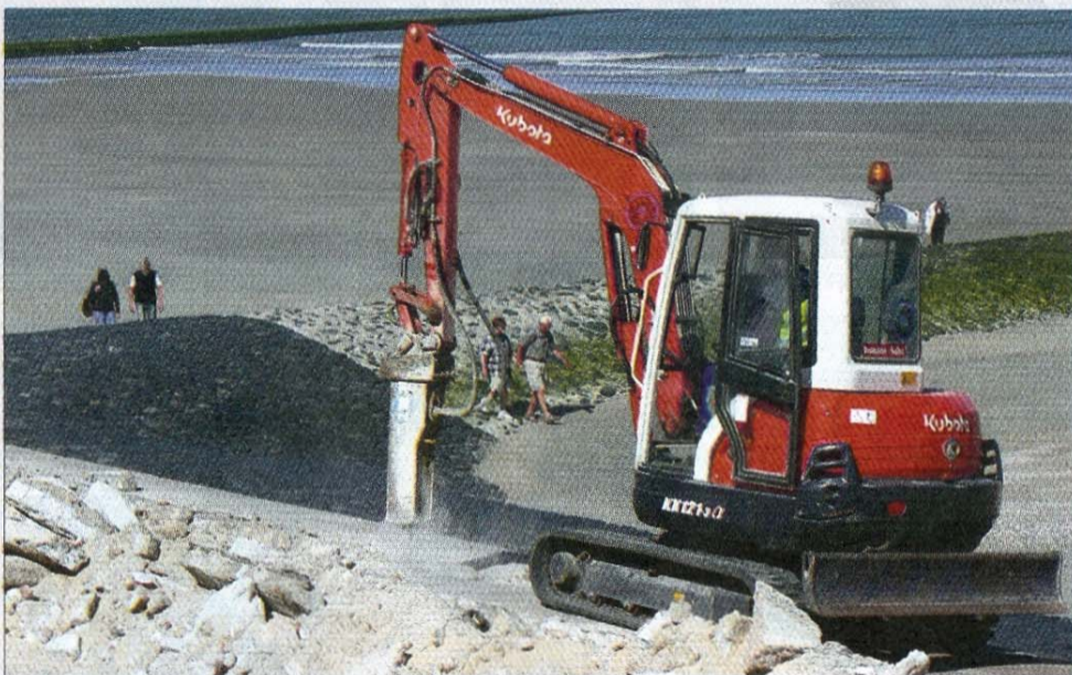
Der Belag der Promenade wird mit diesem Bagger aufgebrochen.