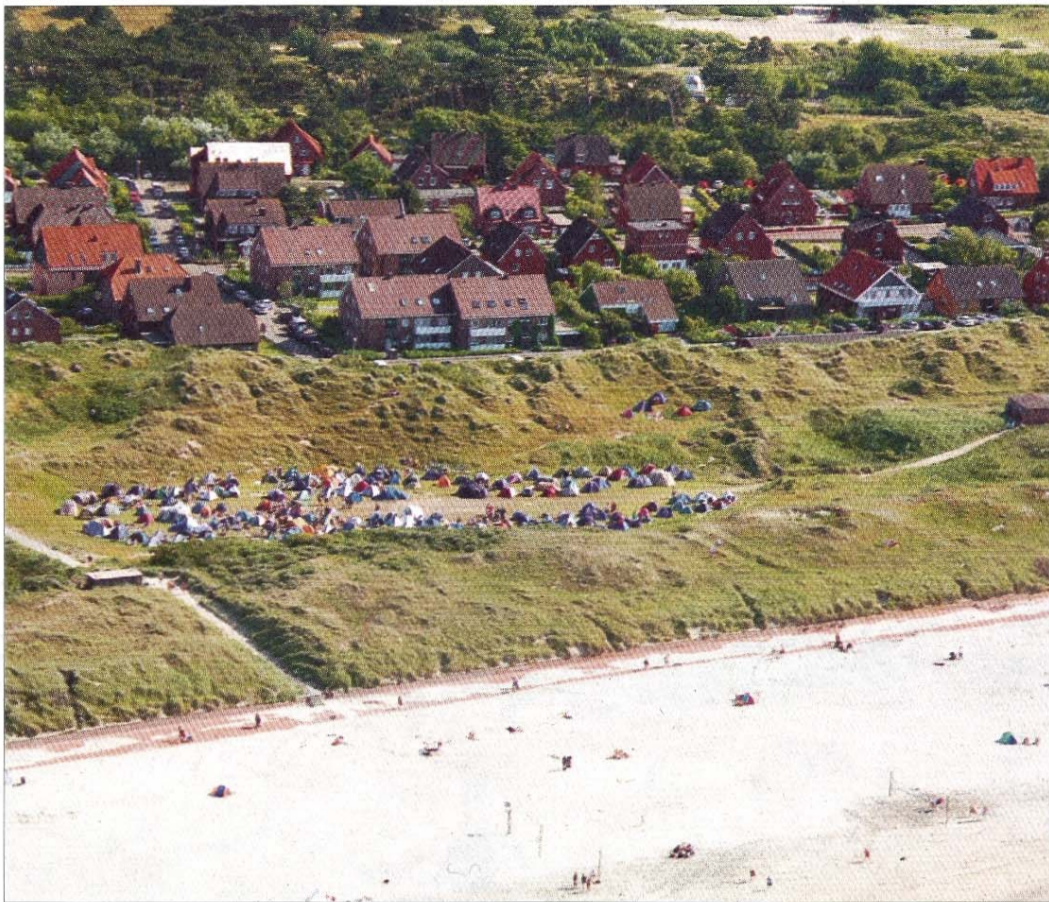
2009 war das Dünenal am Nordstrand bereits einmal für Camper freigegeben worden. Eine Menge Müll und schlechte Eindrücke hinterließen viele der jungen Leute.

Dass sich Veranstalter, Stadt und Staatsbad nun entschie-