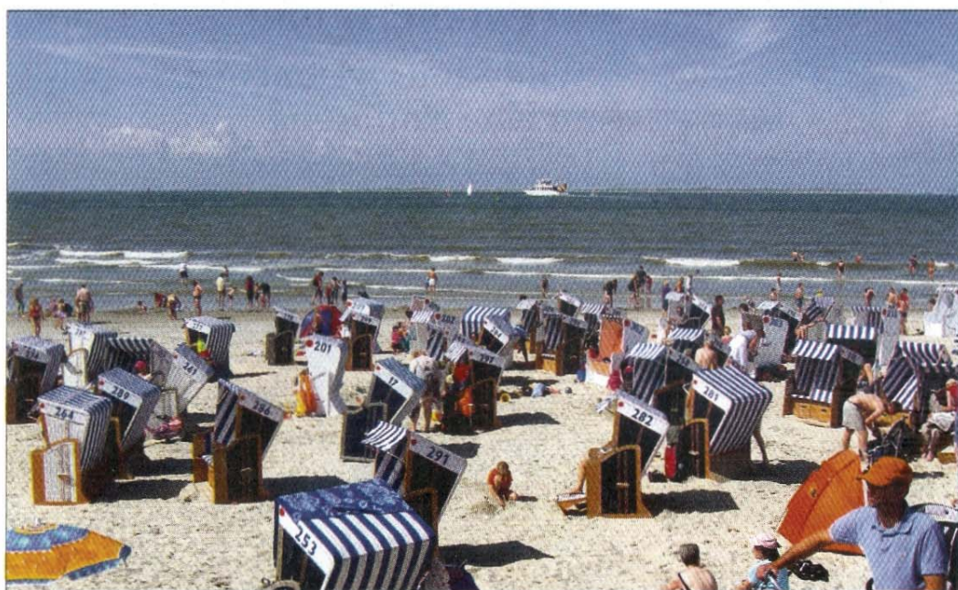
Am Weststrand heute. Blau-weiße Strandkörbe und ein flacher Strand.