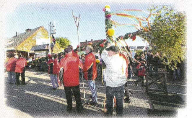
Mit vereinten Kräften wird der Maibaum in der Nordhelm-siedlung aufgestellt.