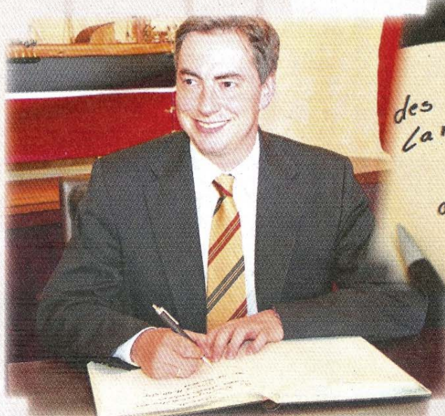
Niedersachsens Ministerpräsident David McAllister beim Eintrag in das Goldene Buch der Stadt Norderney.

Besuch des Ministerpräsidenten des Landes Niedersachsen David McAllister am 01. Mai 2011 David McAllister