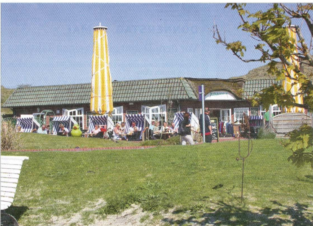
Das Café Oase heute. Sie ist immer noch ein beliebtes Ausflugsziel.