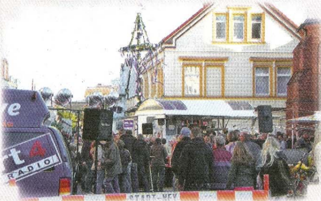
Einheimische und Gäste beim Tanz in den Mai am Denkmal.