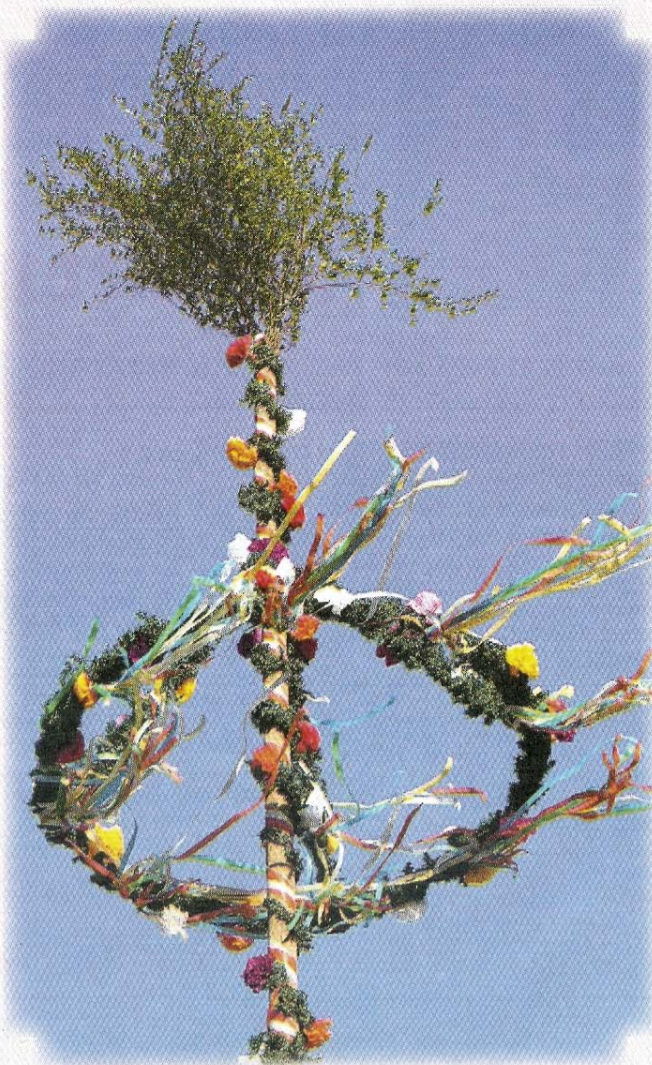
In der Nordhelm-Siedlung ist der Maibaum kunterbunt.