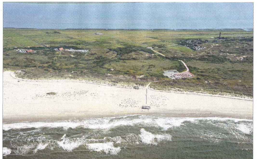
Der FKK-Strand aus der Luft. Deutlich erkennbar ist der breite Strand mit den Vordünen und dahinter der Bereich der Weiß- und Graudünen.