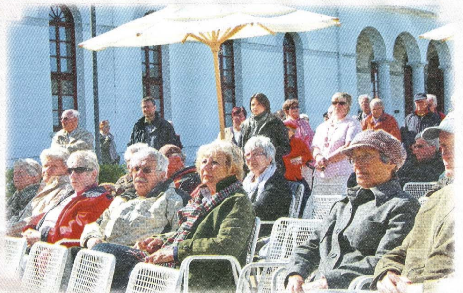
Etlliche Zuhörer waren bei der Maikundgebung am vergangenen Sonntag auf dem Kurplatz.