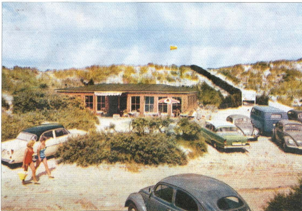
Das erste massive Gebäude am FKK-Strand in den 1960er-Jahren. Es trug damals schon den Namen „Oase“.

dann einem neuen, wesentlich größeren Café-Restaurant-Gebäude weichen: die „Oase“ war entstanden. Ein schöner Platz, umrundet von Dünen. Ein Platz zum Rasten und Ausruhen. In der Vor- und Nachsaison, freitags und sonabends herrscht hier Partystimmung. Die Hin- und Rückfahrt in frischer Luft mit dem Fahrrad sorgt für Hunger und vor allem für auch Durst. Beides kann hier bis zum Überfluss gestillt werden.