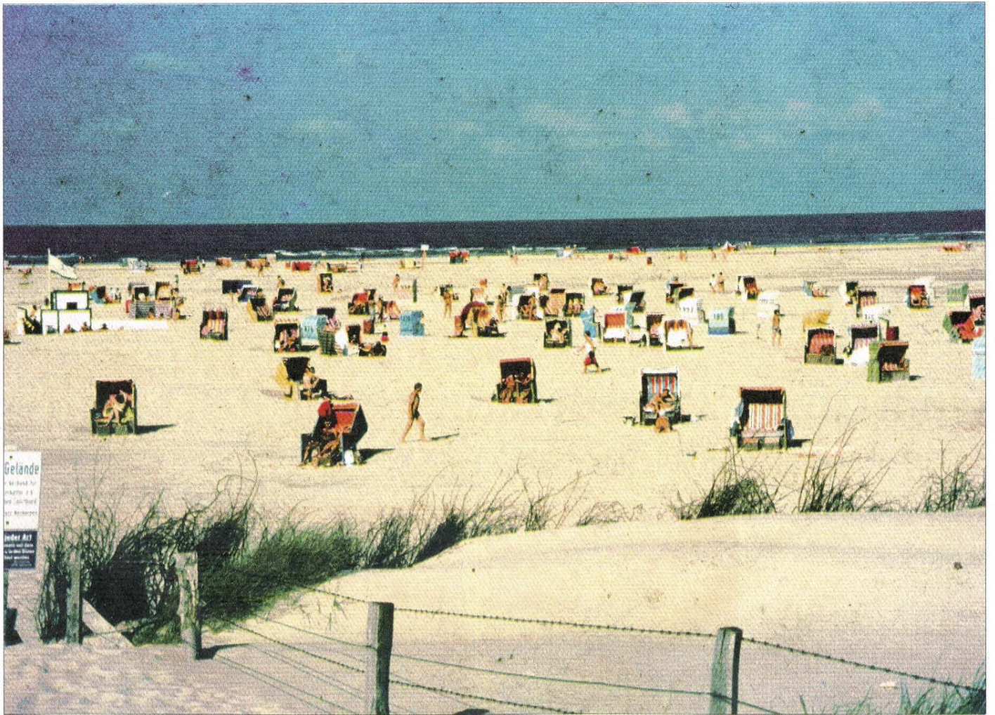
Beste Bedingungen am FKK-Strand: Feiner weißer Pudersand, blaues Meerwasser und Sonne satt. Diese Aufnahme entstand in den 1970er-Jahren.

Strand-Bereich offiziell zu übernehmen, übernahm hingegen am 1. Januar 1975 alle Rechte und Pflichten für den Betrieb des FKK-Strandes auf Norderney. Im Vorfeld der Übernahme hatten die Kurverwaltung und das Bauamt für Küstenschutz die Strandhütten abräumen lassen. Diese Abräumaktion löste erheblichen Ärger bei den Erbauern aus, die viele es als Willkürmaßnahme empfanden, die die Obrigkeit aber als Maßnahme zur Gefahrenabwehr begründete. Die weitere Entwicklung vollzog sich danach in ruhigem Fahrwasser. Eine Ergänzung der Erschließung erfolgte 1975 durch die Verlegung ei-