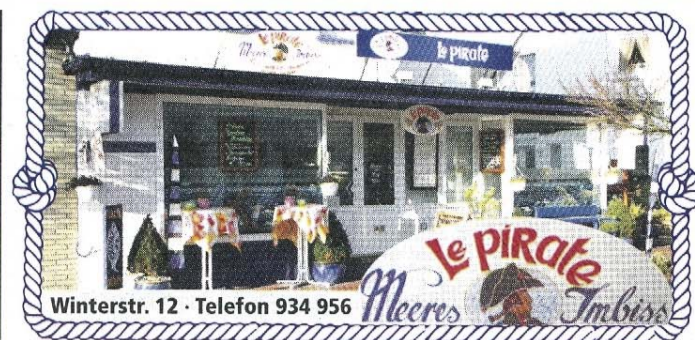
Winterstr. 12 · Telefon 934 956