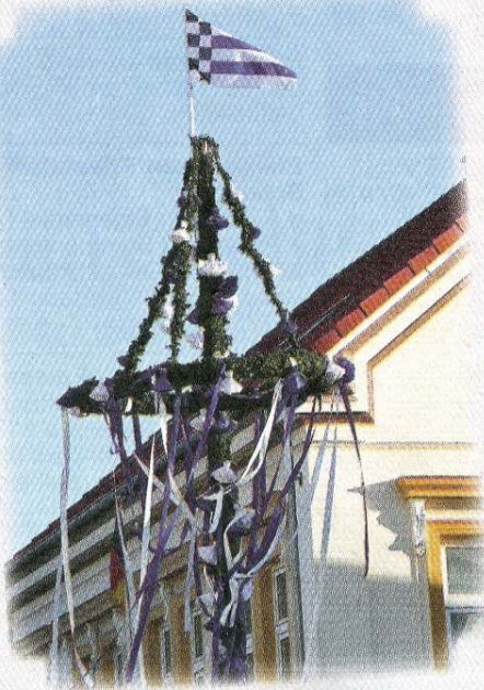
Traditionell blau und weiß geschmückt: der Maibaum am Denkmal.