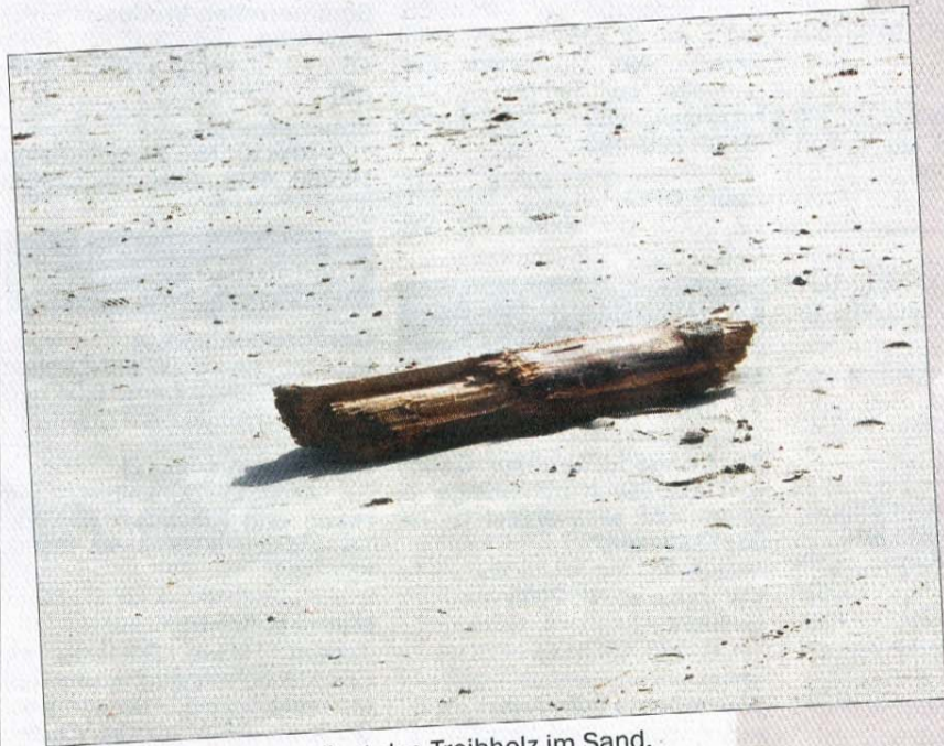
Einsam und verlassen liegt das Treibholz im Sand.