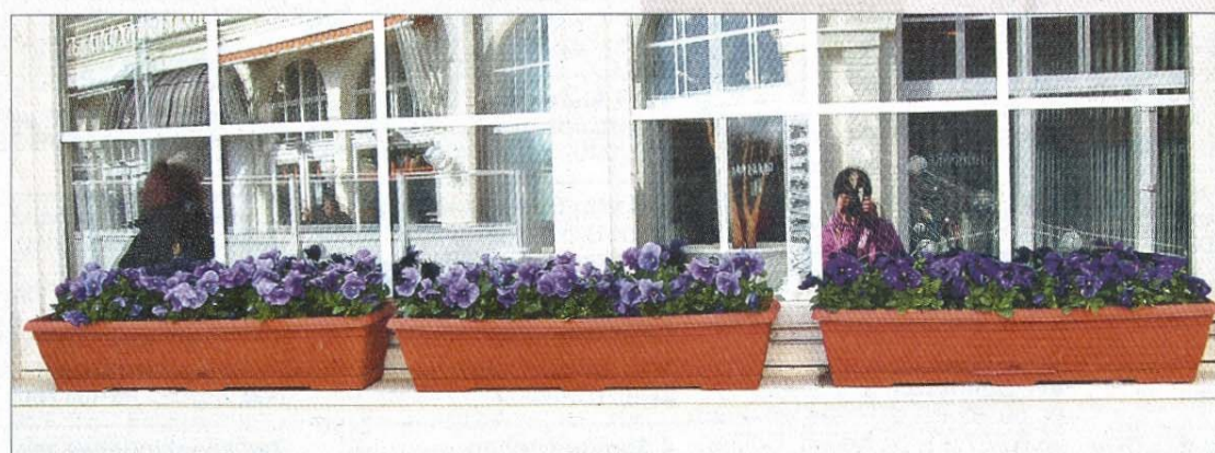
Beim Fotografieren von schönen Blumen hat sie sich selbst erwischt.