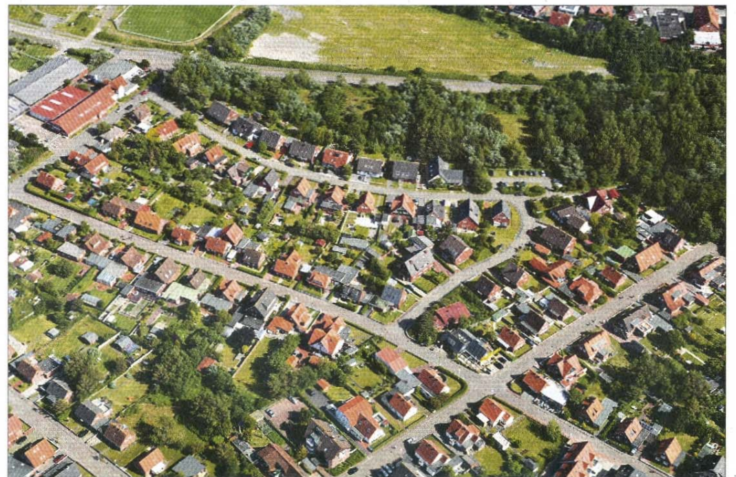
Der Pflanzstreifen oben dient als Lärmschutz für die Oderstraße.