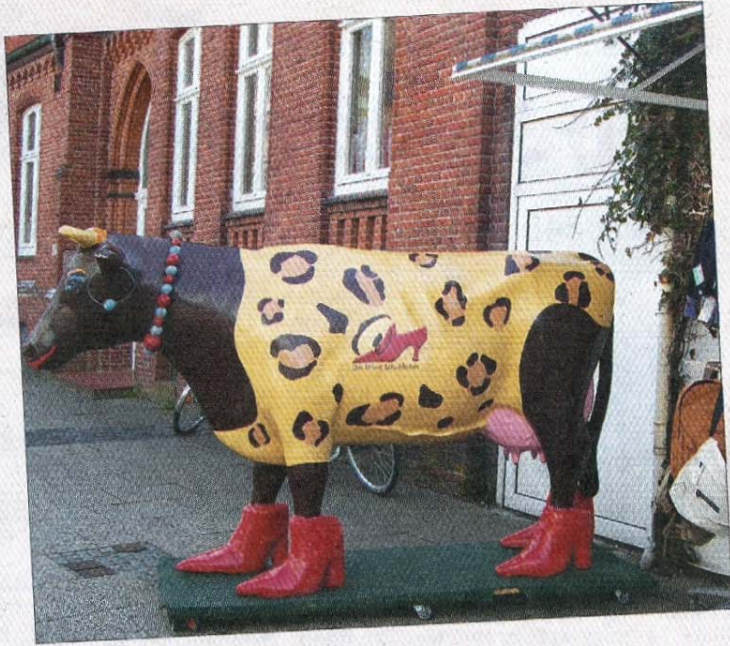
Eine Kuh mit roten „Schuh'n“.