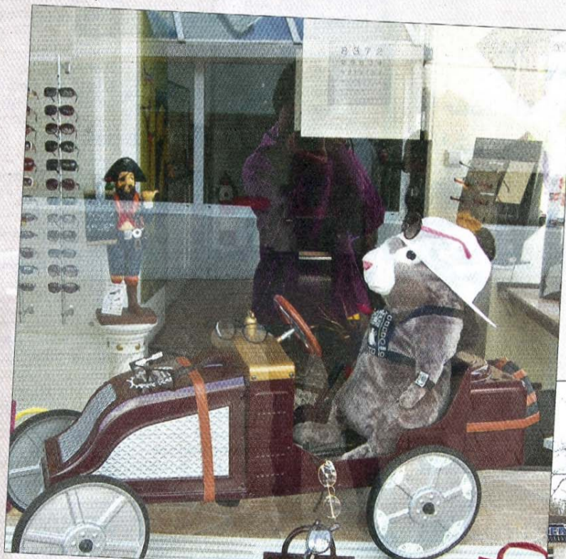
Ein Meerschweinchen beim Seifenkisten-Rennen.