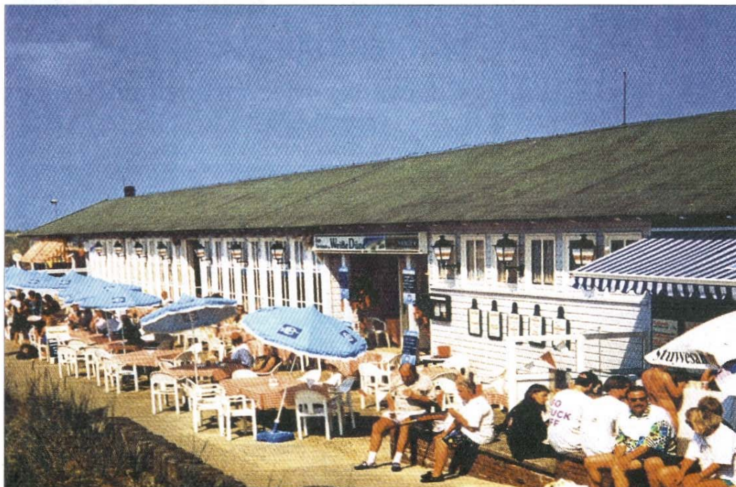
Terrasse Restaurant Weiße Düne in den 1990er-Jahren.

Fortsetzung der Berichterstattung im nächsten NORDERNEY KURIER.