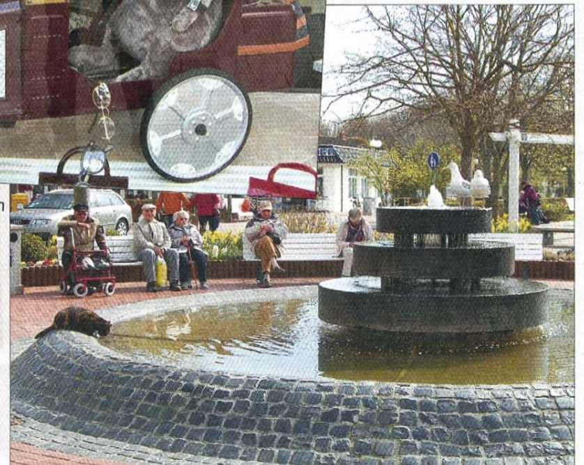
Beim morgentlichen Bad halten die Möwen die Katze im Auge.