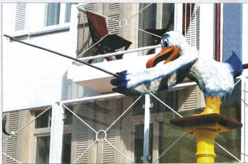
Erwischt, der Fisch hängt an der Angel.