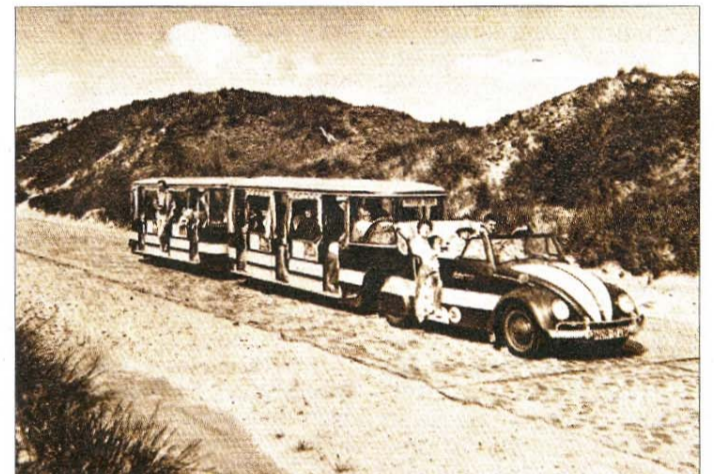
Der VW-Gliederzug fuhr früher viele Inselgäste zur „Weißen Düne“.

Toilettenanlage angebaut. Die Baulichkeiten zu errichten war verhältnismäßig einfach, die Betreuung aber umso schwieriger, denn es gab weder eine Strom-, Wasser- oder Telefonleitung. Die Kochherde wurden mit Kohle beheizt, die Wasserversorgung erfolgte direkt über einem Bohrbrunnen aus der Süßwasserlinse und wurde vom Fuß der Dünen in einen 2000-Liter-Vorratsbehälter hochgepumpt. Die Beleuchtung konnte nur durch