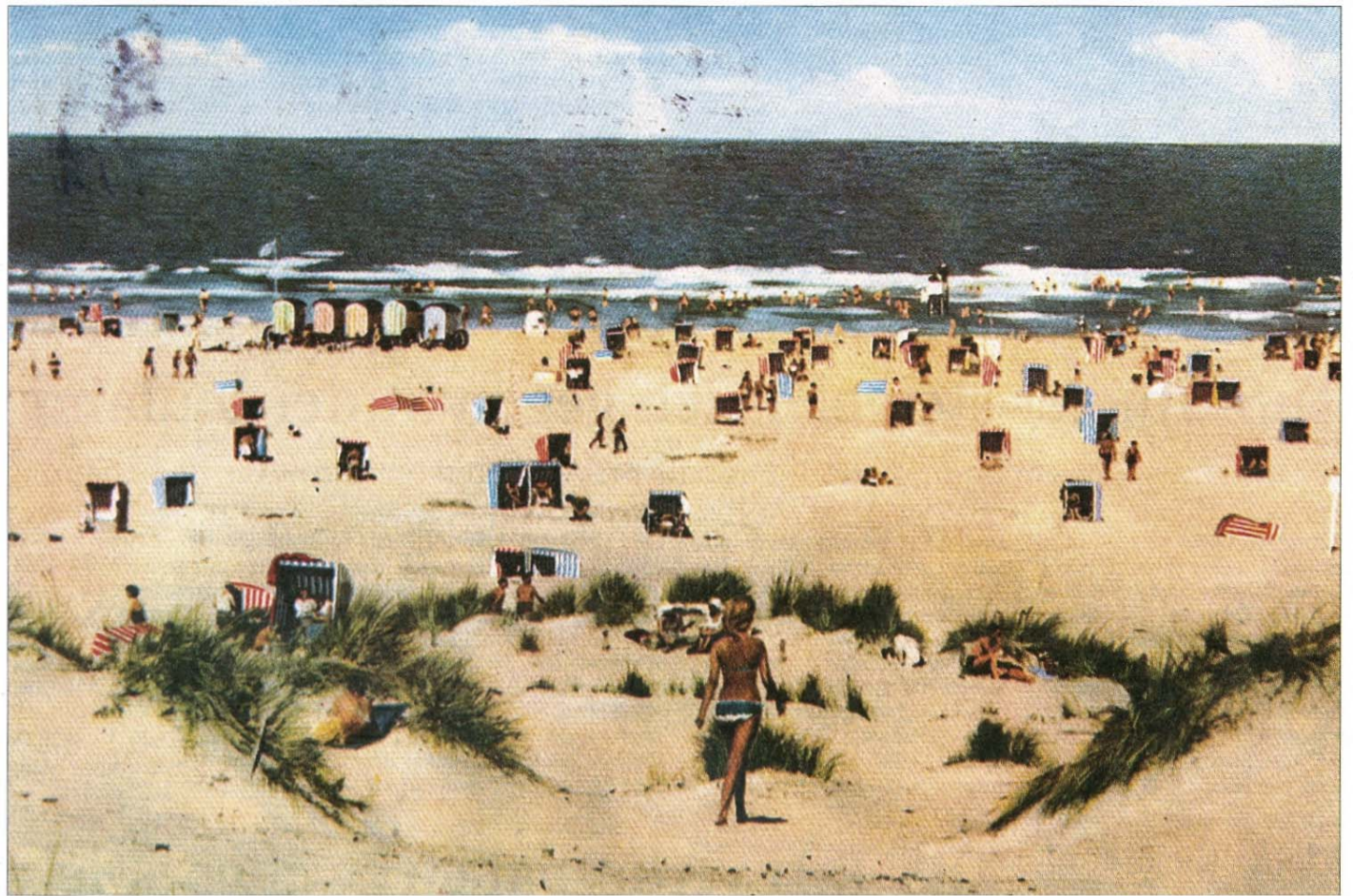
Der Ostbadestrand „Weiße Düne“ in den 1950er-Jahren. Badekarren (im Hintergrund) und Strandzelte sorgen für viele bunte Farbtupfer im weißen Pudersand.

Asphaltstraße wiederverwandelt. Jedenfalls war eine neue Straße von der Stadt zum Osten vorhanden. Ab Schießstand wurde noch eine neue Abzweigung in Richtung Weiße Düne geschaffen. Auf dem Fahrdamm der Trasse der Marinebahn wurde die Betonstraße bis zur Weißen Düne verlängert, später erfolgt noch eine Verbreiterung durch Kopfsteinpflaster. Die Schwellen der ehemaligen Marinebahn wurden in der Nachkriegszeit verheizt und die Schienen verschrottet. Die Baustelleneinrichtung zum Bau der Betonstraße befand sich auf einem Sportplatz zwischen der Meierei und dem Bahnhof Stelldichein, der nach Schaffung der Sportanlagen an der Mühle durch das Militär nicht mehr benötigt wurde. Der kahle, unbewachsene Bereich zwischen der Meierei, dem Bahnhof Stelldichein wird nördlich