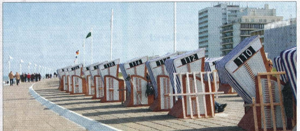
In Zweierreihen der Sonne entgegen – Strandkörbe auf der Strandpromenade.