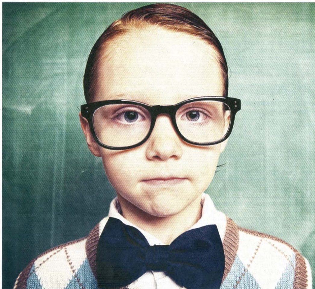
Junger Mann mit ganz viel Durchblick, er muss aber nicht zwingend genauso aussehen oder so eine große Brille tragen. Das Staatsbad Norderney sucht im Rahmen der Aktion „Meine Insel“ einen Kinderkurdirektor.

Ein Jahr lang soll der neue Mini-Staatsbad-Chef die Interessen der Insel-Kinder und die der Gäste vertreten. Er wird im Kinder- und Jugendspielpark Kap Hoorn sein Büro haben. „Er begrüßt die jungen Gäste, er moderiert, animiert, betreut und schmiedet kleine und große Pläne“, betonen