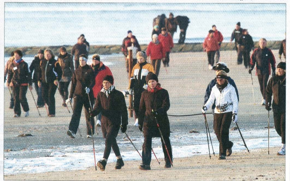
... Richtung Weststrand.