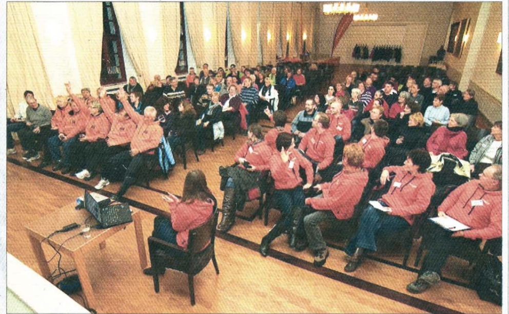
Am Vorabend wurden die Teilnehmer umfassend geschult und informiert.