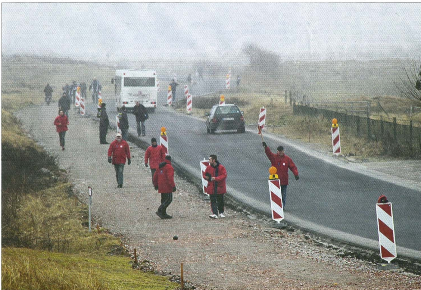
Schon wieder ist der Kloot im Schotter gelandet. Im Vordergrund in Rot die Boßler von Siedlung.