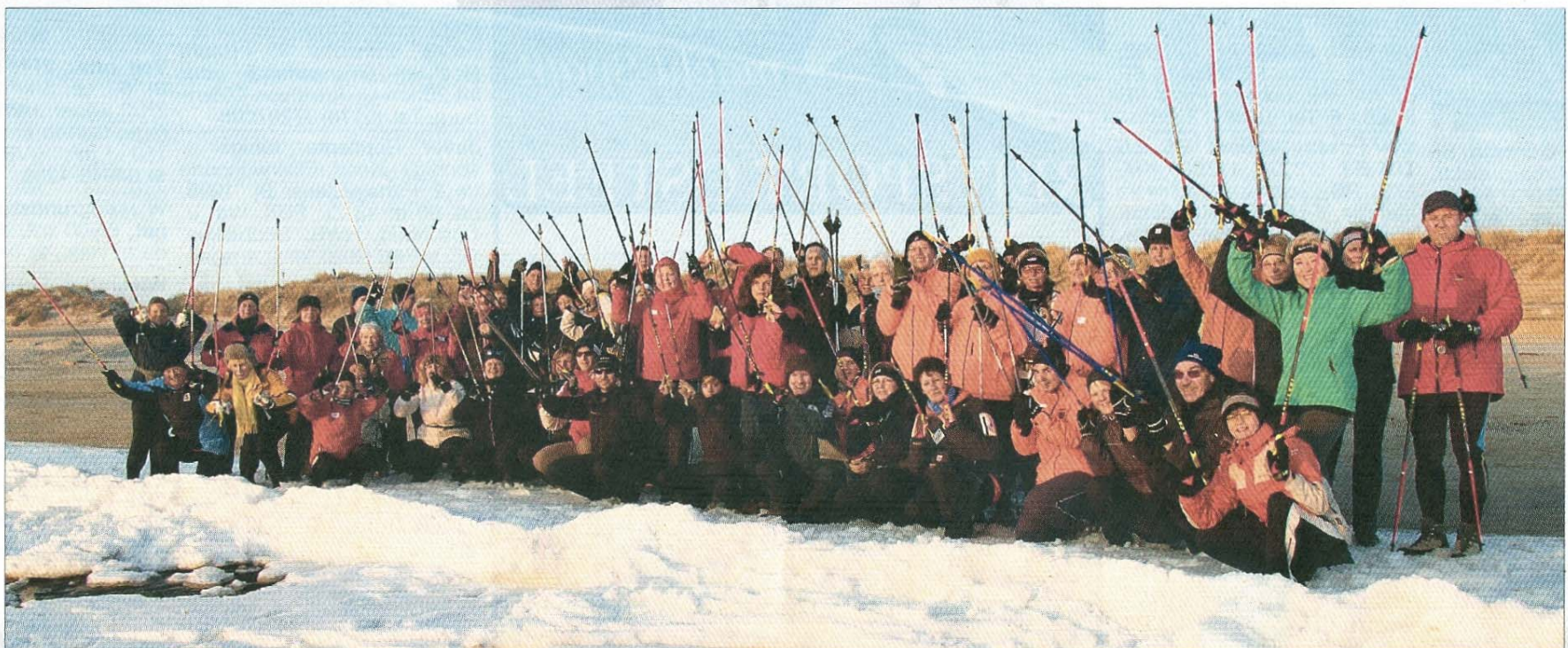
Gruppenfoto der Teilnehmer des 5. Walking- /Nordic-Walking-Wochenendes im Schnee am Weststrand der Insel.