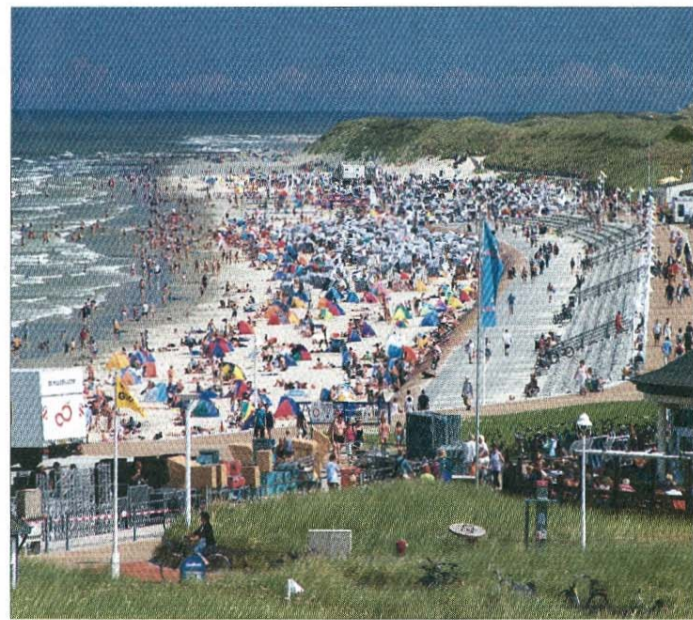
Der Nordstrand im Hochsommer 2010. Viele bunte Strandzelte und blau-weiße Strandkörbe prägen das Bild.

gerten Reinigungsduschen. Die Infrastruktur für diesen Strandbereich erhielt nach der Sturmflut eine komplette Aufrüstung. Die Entwicklung am Nordstrand als zentraler Badestrand geht weiter. Es gibt Übergänge aus dem Ortsteil Nordhelm am Waldweg, der Elbestraße und am Birkenweg. In den 1960er-Jahren wurde in Verlängerung der Elbe-