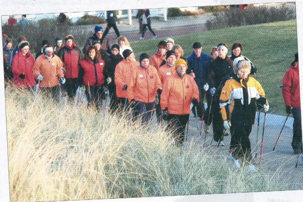
An der Milchbar entlang...