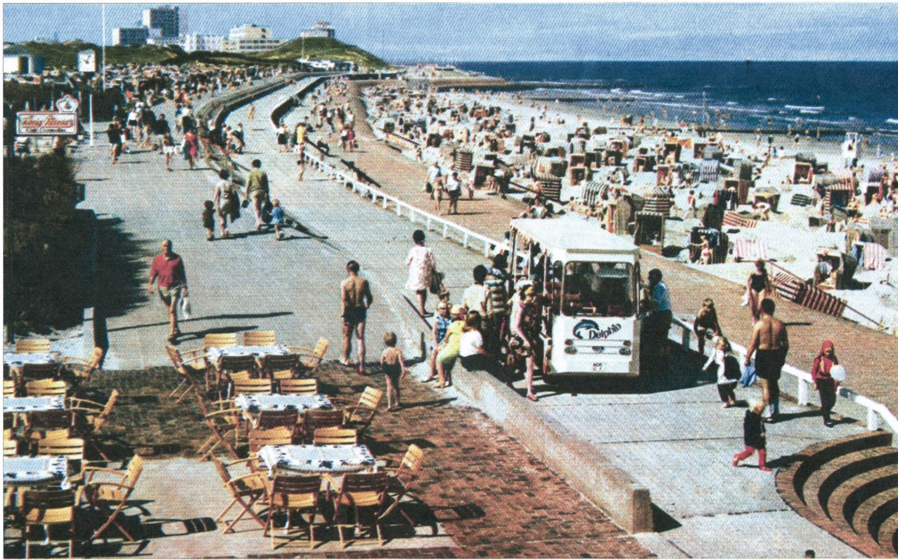
Für Viele noch ein bekanntes Bild: Der Nordstrand in den 1970/80er Jahren mit dem Blick auf den Januskopf und der Elektrobahn. Im Hintergrund ist auf der Georgshöhe noch das Gebäude der alten Wetterwarte zu sehen.

Dazu gehörte auch der Bereich Nordstrand zwischen dem Januskopf und dem Café Cornelius.