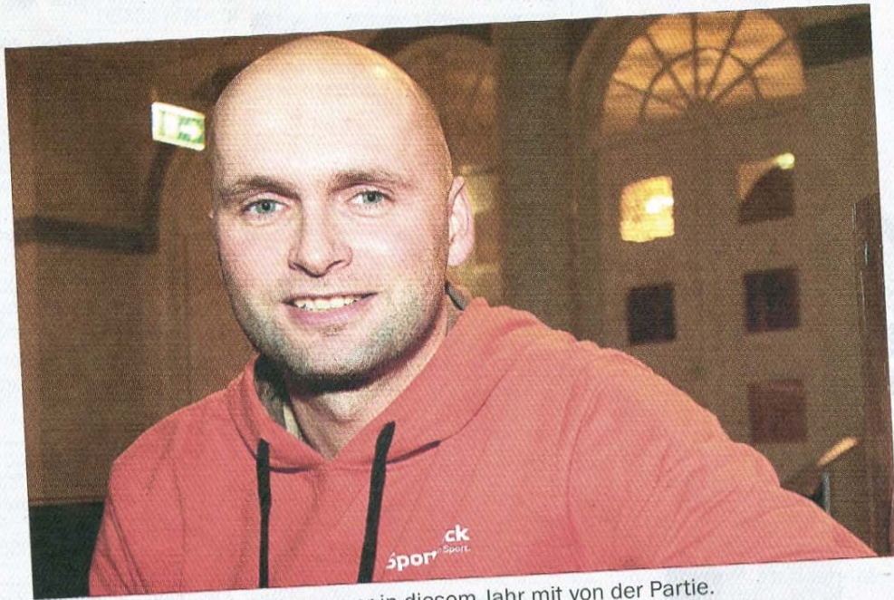
Olympiasieger Nils Schumann war in diesem Jahr mit von der Partie.