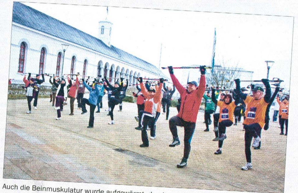
Auch die Beinmuskulatur wurde aufgewärmt, damit es zu keinen Zerrungen kommt.