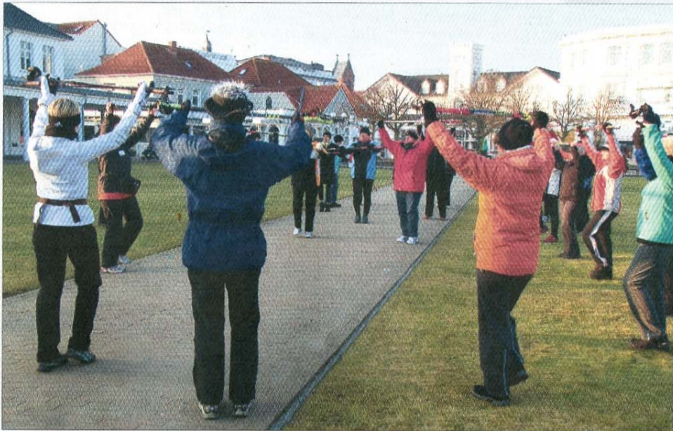
Aufwärmtraining Sonnabend früh auf dem Kurplatz.