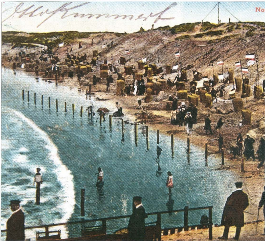
Nordstrand um 1910, der Badebereich entwickelt sich.