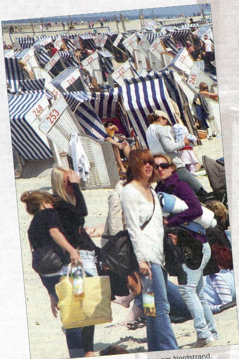
Erst mal orientieren. Festival-Besucher am Nordstrand.