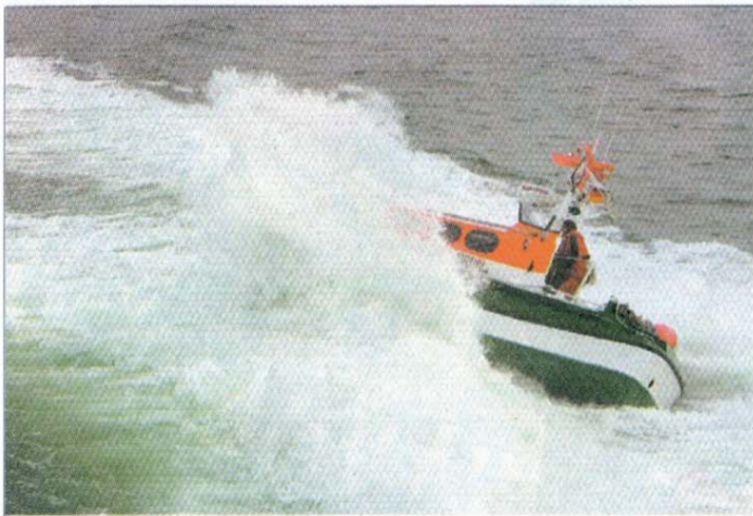
Am Sonnabend um 15 Uhr ist Schuppentag am Rettungsbootschuppen am Weststrand. Bestaunt werden kann das historische Rettungsboot „Fürst Bismarck“ sowie eine Ausstellung über den Werdegang der Rettungsstation Norderney. Eintritt: frei, um Spenden wird gebeten.

15 Uhr , Westschulhof Grundschule. Sommerfest des Förderkreises der Norderneyer Schulen. 17 Uhr , Puppentheater Purzelbaum an der Schmiedestraße. Das Stück „Der Wettlauf zwischen Hase und Igel“