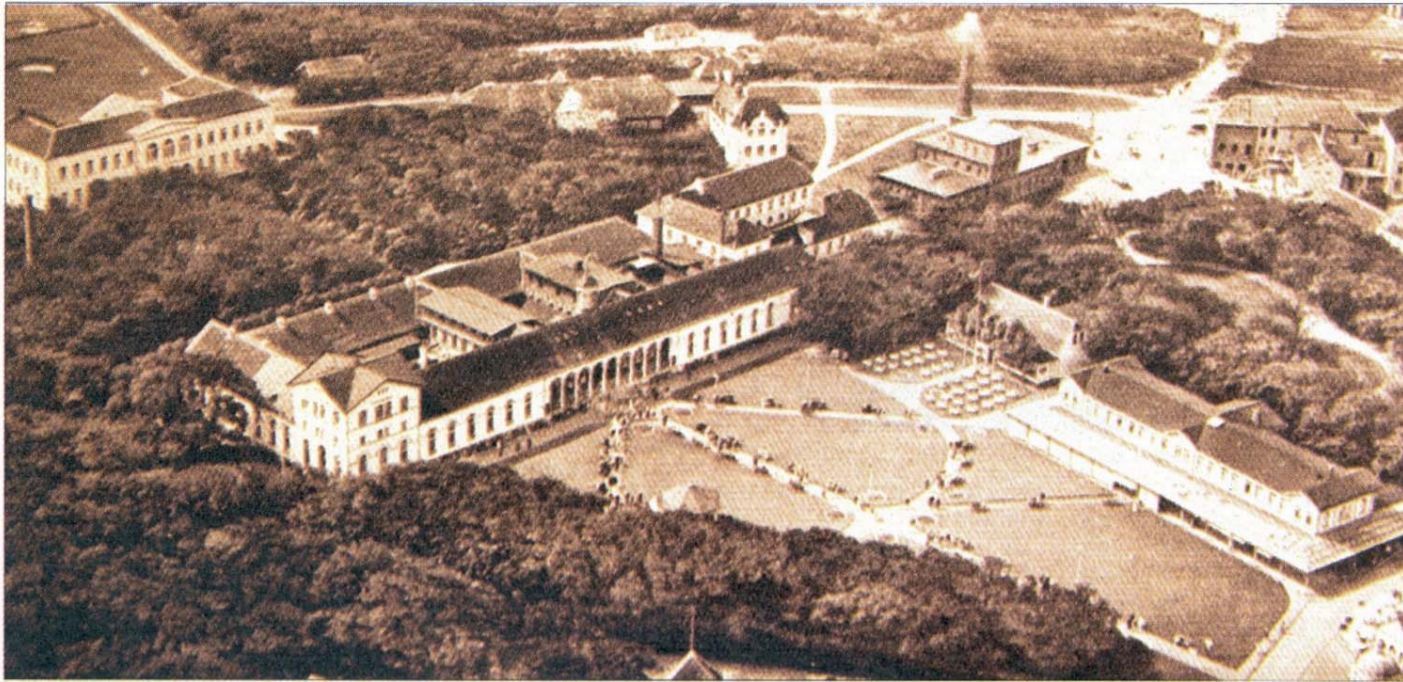
Dieses Foto, das vor 1929 entstanden ist, zeigt den Bereich des Kurplatzes mit dem westlichen Anbau des Warmbadehauses. Zu sehen ist noch das alte Kessel- und Maschinenhaus und das Café Hoegel, wo jetzt das Badehaus steht.

Am 29. Juni 1866 besiegte Preußen bei Langensalza das österreichische Heer. Das Königreich Hannover war mit Österreich verbündet und wurde durch die Niederlage wieder preußische Provinz. Die hannoversche Ära und der Einfluss der Welfen waren beendet.