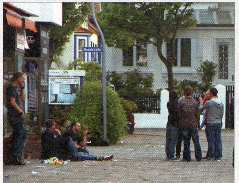
Die erste „Schlacht“ ist geschlagen. Eine kleine Pause muss sein. Schön sieht es auf Straßen und Plätzen aber nicht gerade aus.