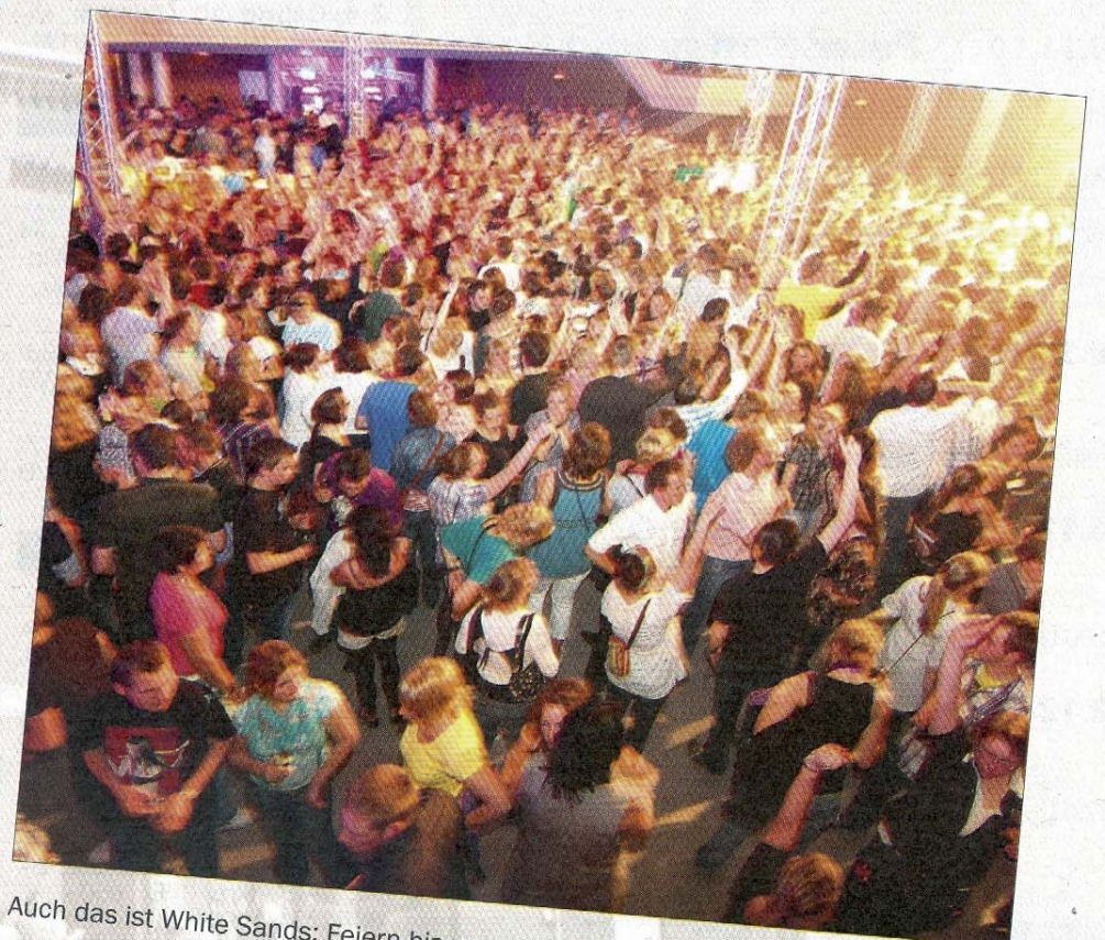
Auch das ist White Sands: Feiern bis zum Abwinken.