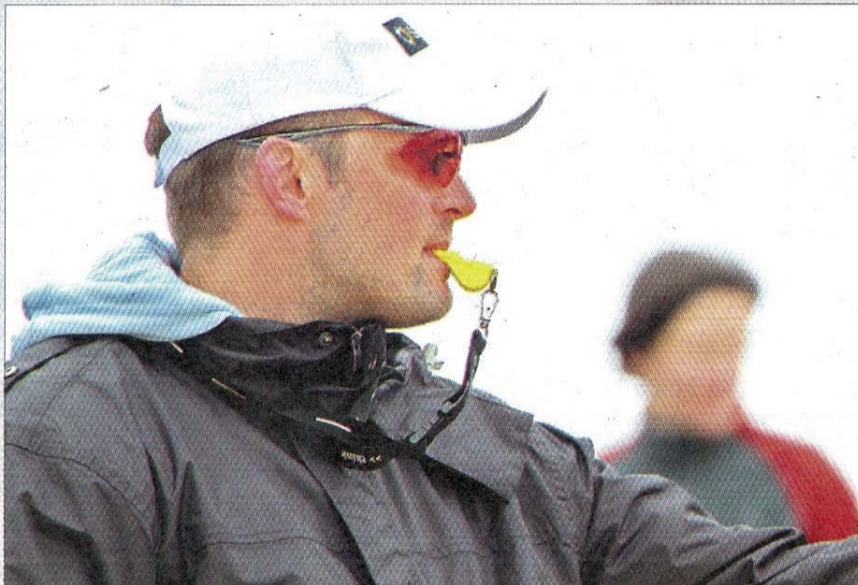
Anpiff – sportlich gesehen beim Beachvolleyball.