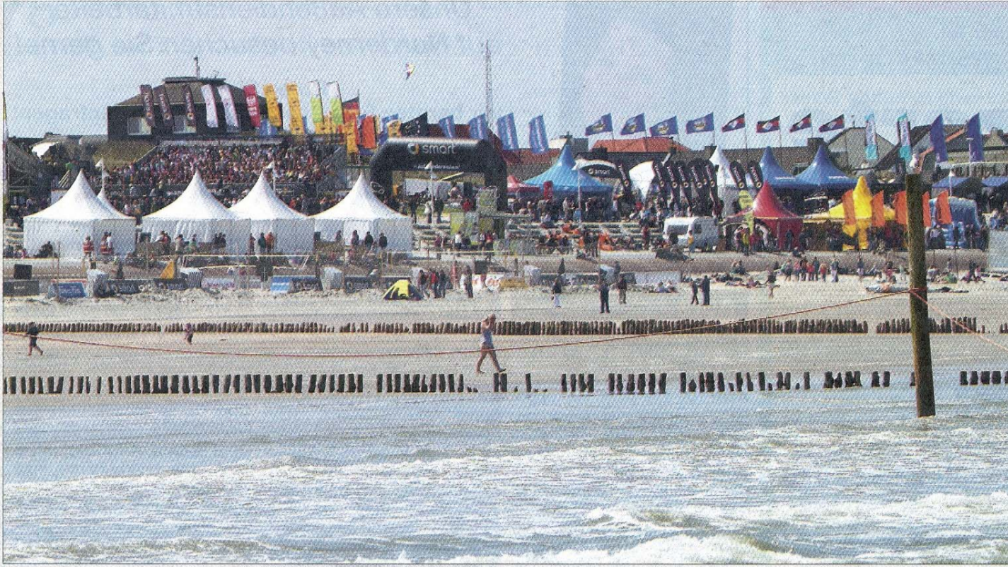
Eine prächtige Kulisse bot sich den Gästen Norderneys beim White Sands Festival 2010.