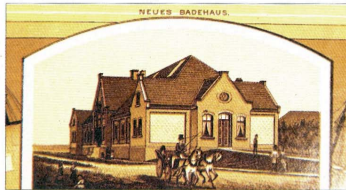
So sah eines der Badehäuser um 1844 aus.

1914, mit Ausbruch des Ersten Weltkrieges, wurde die gedeihliche Entwicklung erneut jäh unterbrochen. Die Insel war um diese Zeit mit Kurgästen voll besetzt, kaum ein Bett war mehr frei. Gibt es Krieg, war die bange Frage? Nach der Kriegserklärung leerte sich die Insel schlagartig von Gästen und füllte sich nach der Mobilmachung mit Soldaten. Das Militär bezog seine Unterkunft im Seehospiz. Der Fremdenverkehr brach zusammen, und es kehrte wirtschaftliche Not ein. Die wirtschaftliche Grundlage der Insel war weggebrochen. Hotel- und Logierhausbesitzer, Gastronomen und Kaufleute konnten ihren Lebensunterhalt nur dadurch sichern, dass sie sich als Arbeiter bei der Erstellung der militärischen Befestigungsanlagen verdingten.