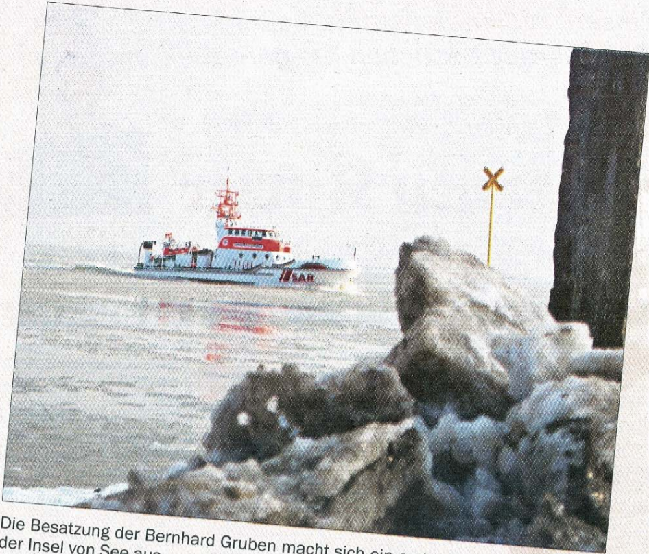
Die Besatzung der Bernhard Gruben macht sich ein erstes Bild des Winters auf der Insel von See aus.