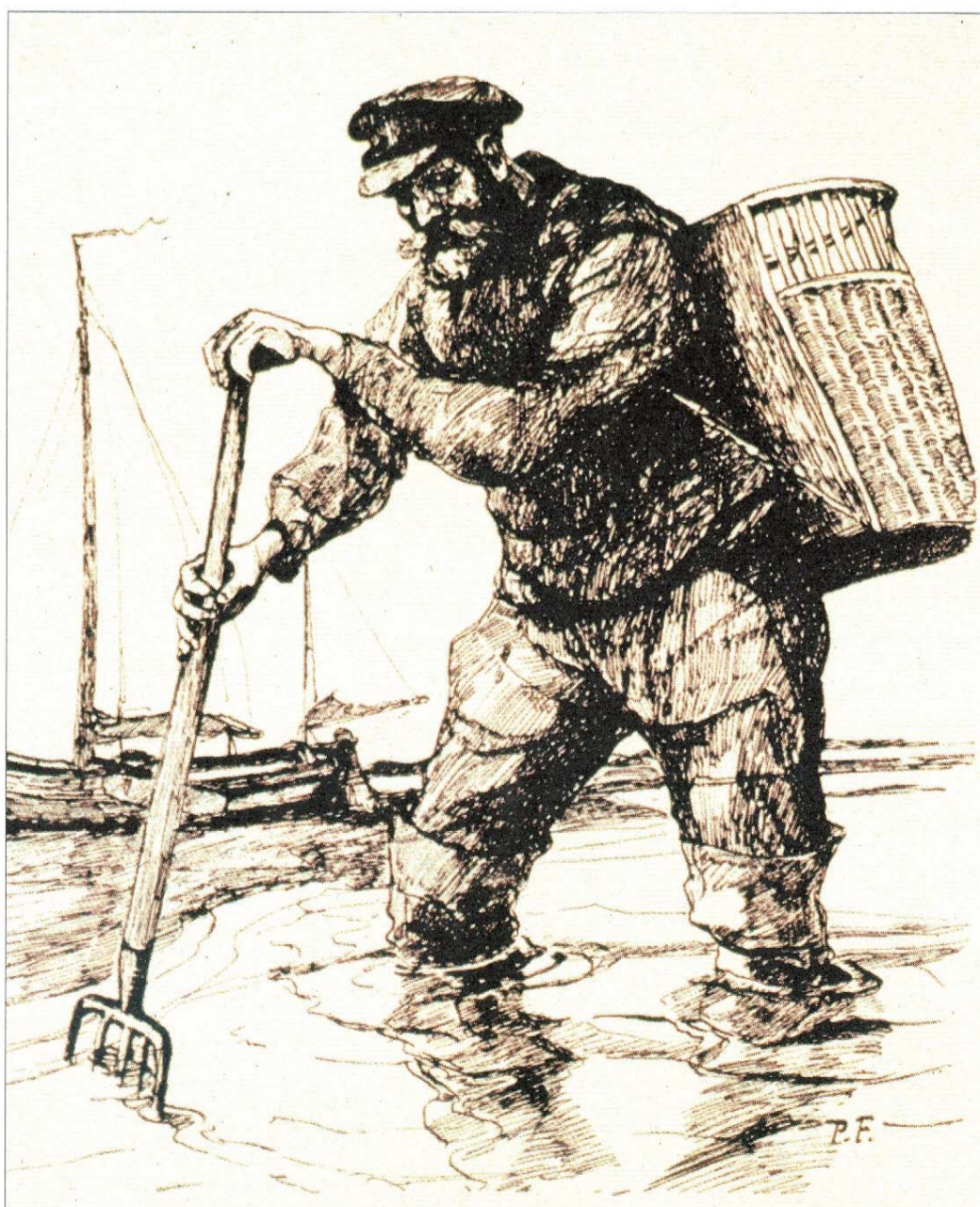
Buttspricken: Butt wurde mit einer fünfzinkigen Gabel gestochen.