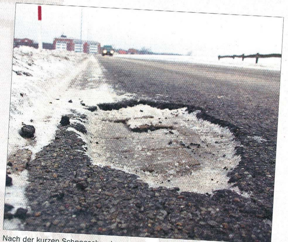
Nach der kurzen Schneeschmelze werden schnell die ersten Straßenschäden sichtbar.