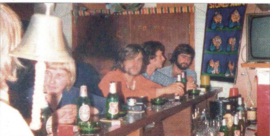
Hoch die Tassen. Der 11. 11. aus der Sicht des wachfreien Seemanns.

Ob wir da wohl überirdischen Geleitschutz hatten?