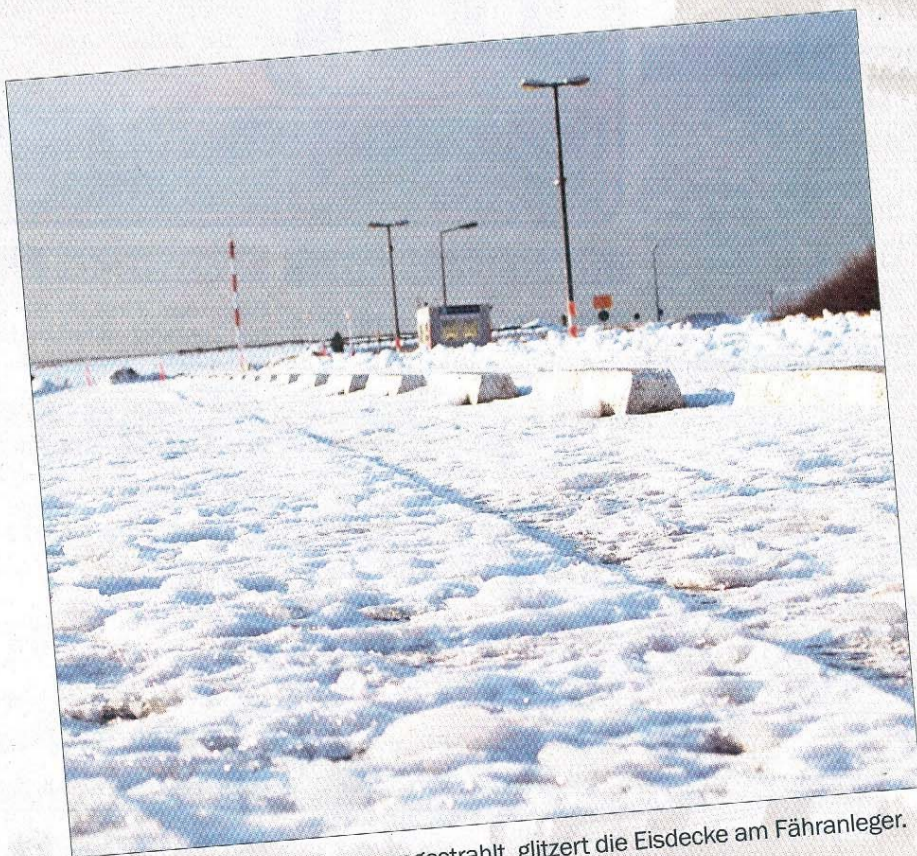
Wunderschön von der Sonne angestrahlt, glitzert die Eisdecke am Fähranleger.