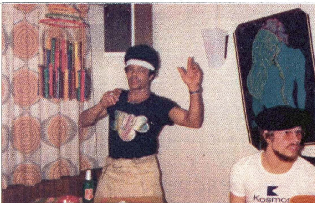
Karneval im Bermudadreieck: Da wird auf dem Schiff auch der Westafrikaner aktiv.

Warum man ausgerechnet auf einem profanen Massengutfrachter mit überwiegend norddeutscher Besatzung und einer Teilbesatzung aus unseren islamischen und afrikanischen Bruderländern Karnevalsbeginn feiern muss, war zu Anfang nicht allen klar, aber die Überirdischen müssen auch hier Überzeu-