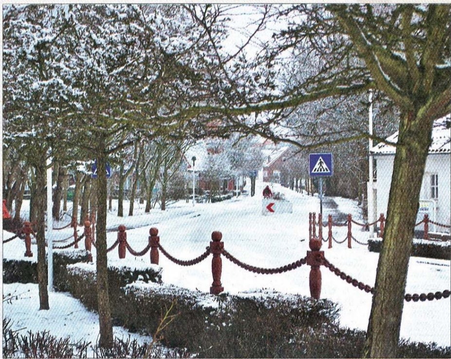
Wie Puderzucker legt sich der Schnee auf Bäume, Straßen und Gehwege.