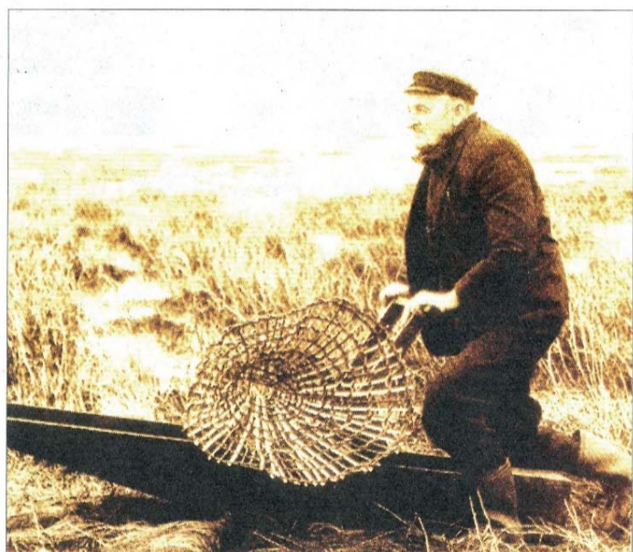
Bei Ebbe ernteten die Fischer mit einem speziellen Wattgefährt, dem sogenannten Kreyer oder Schlickrutscher, den Fisch ab.