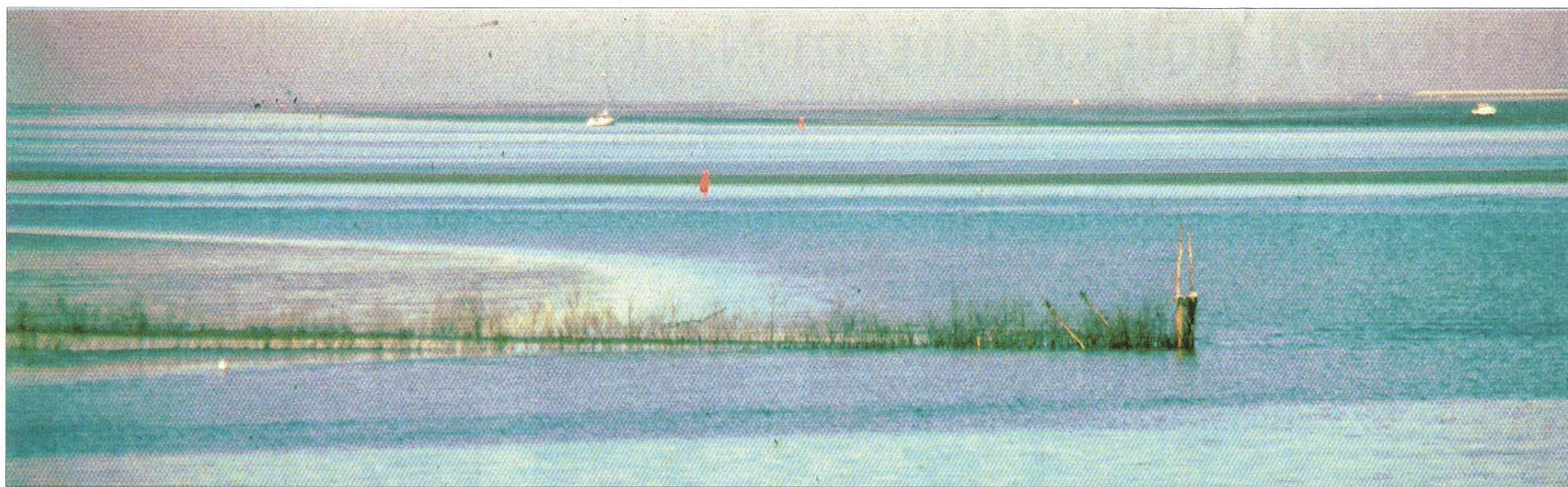
Spezielle Konstruktionen im Wattenmeer ermöglichten den Fischern vor Jahrhunderten eine Fangmethode, die äußerst erfolgreich war. Diese Art wurde Argenfischerei genannt.