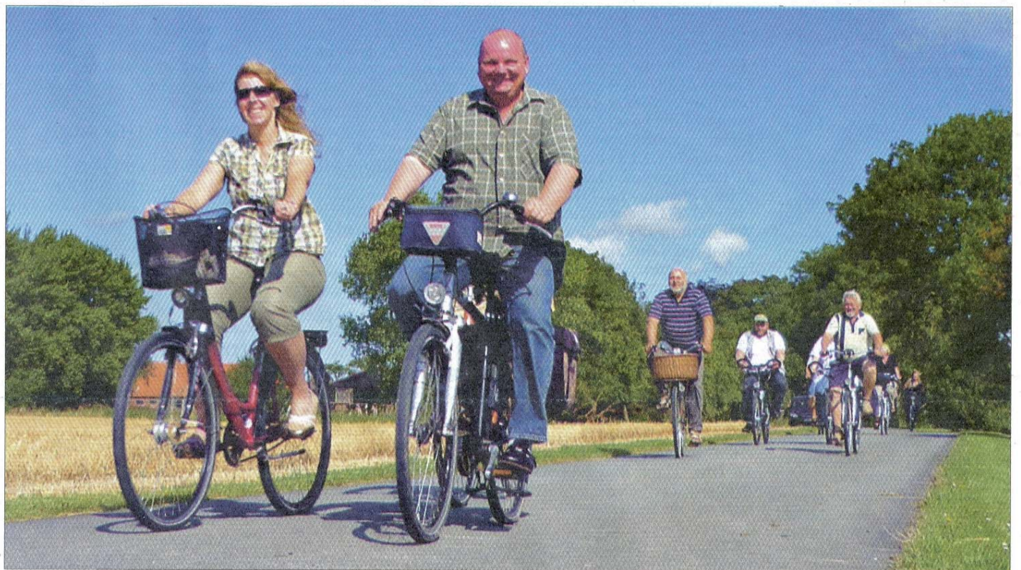
Schönes Wetter wie auf diesem Foto erhoffen sich die Organisatoren des TuS Norderney für die große Radtour im April.

Jedermann heißt schlussendlich, dass der Besitzer des normalen Gazelle-Fahrrads