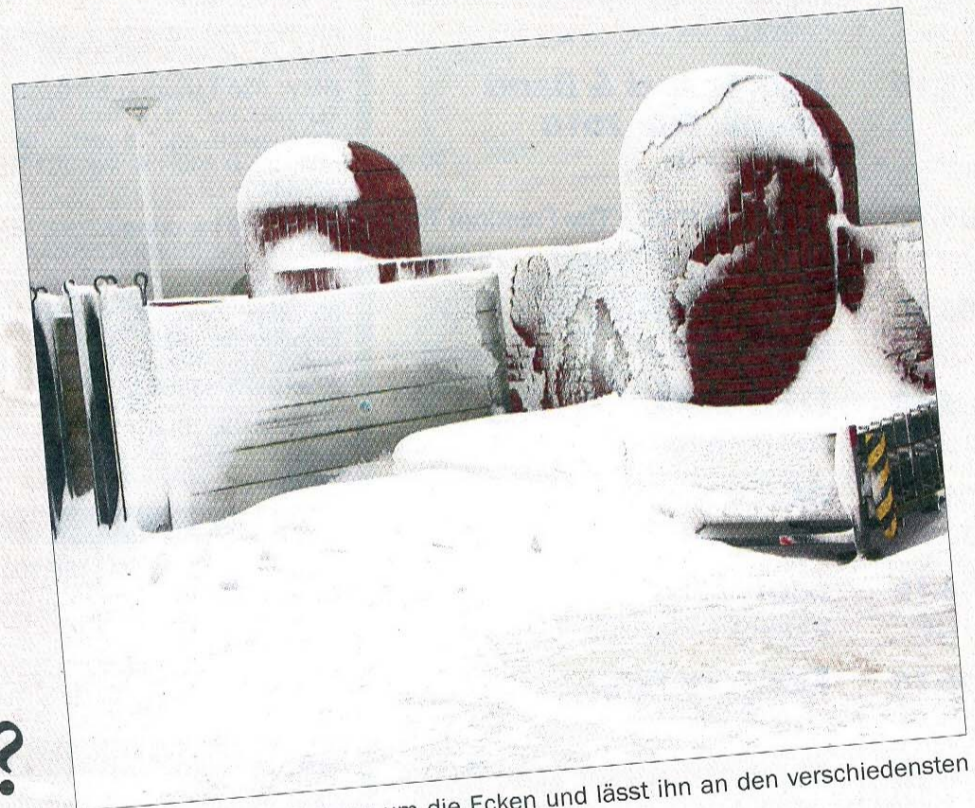
Der Wind fegt den Schnee um die Ecken und lässt ihn an den verschiedensten Stellen haften.