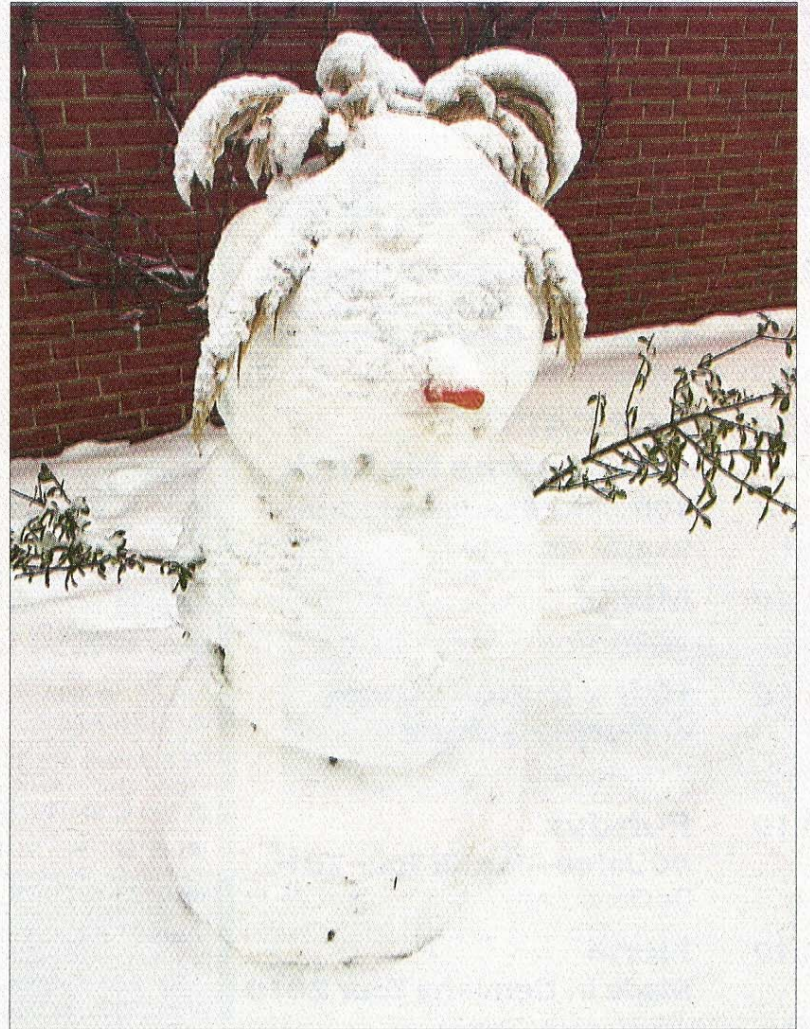
Auch der Schneemann aus der ersten Schneeperiode ist von der zweiten eiskalt erwischt worden.