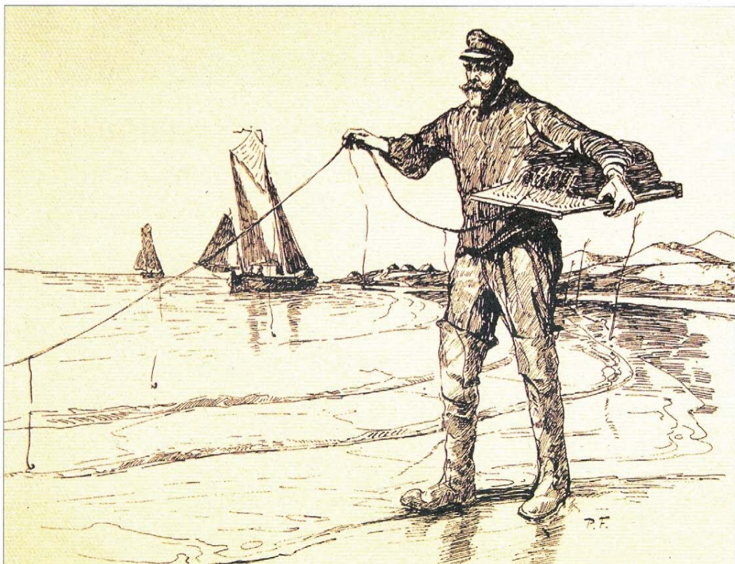
Butt-Wantsetten: An den Rändern der Wattpriele legten die Fischer lange Leinen.