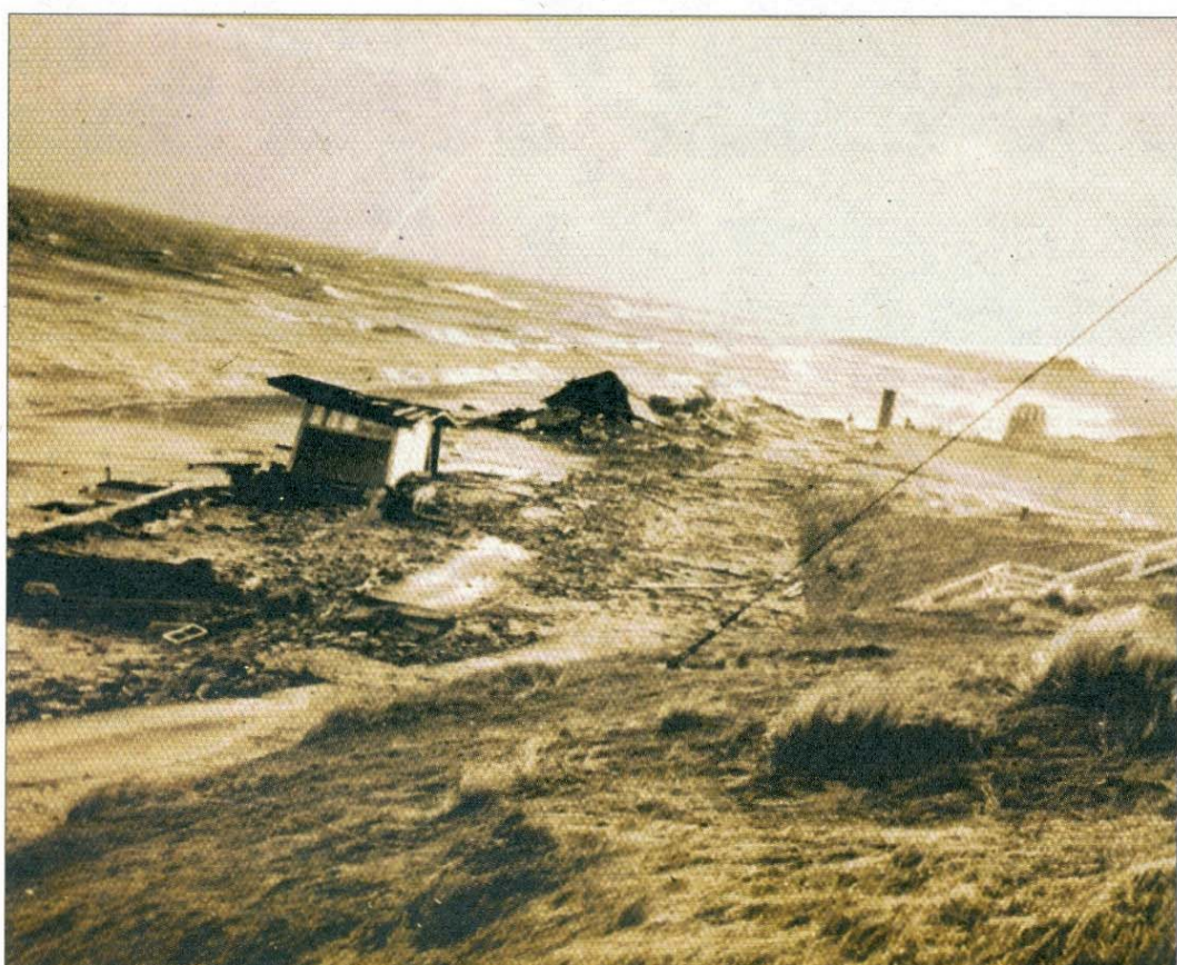
Vor der Georgshöhe.