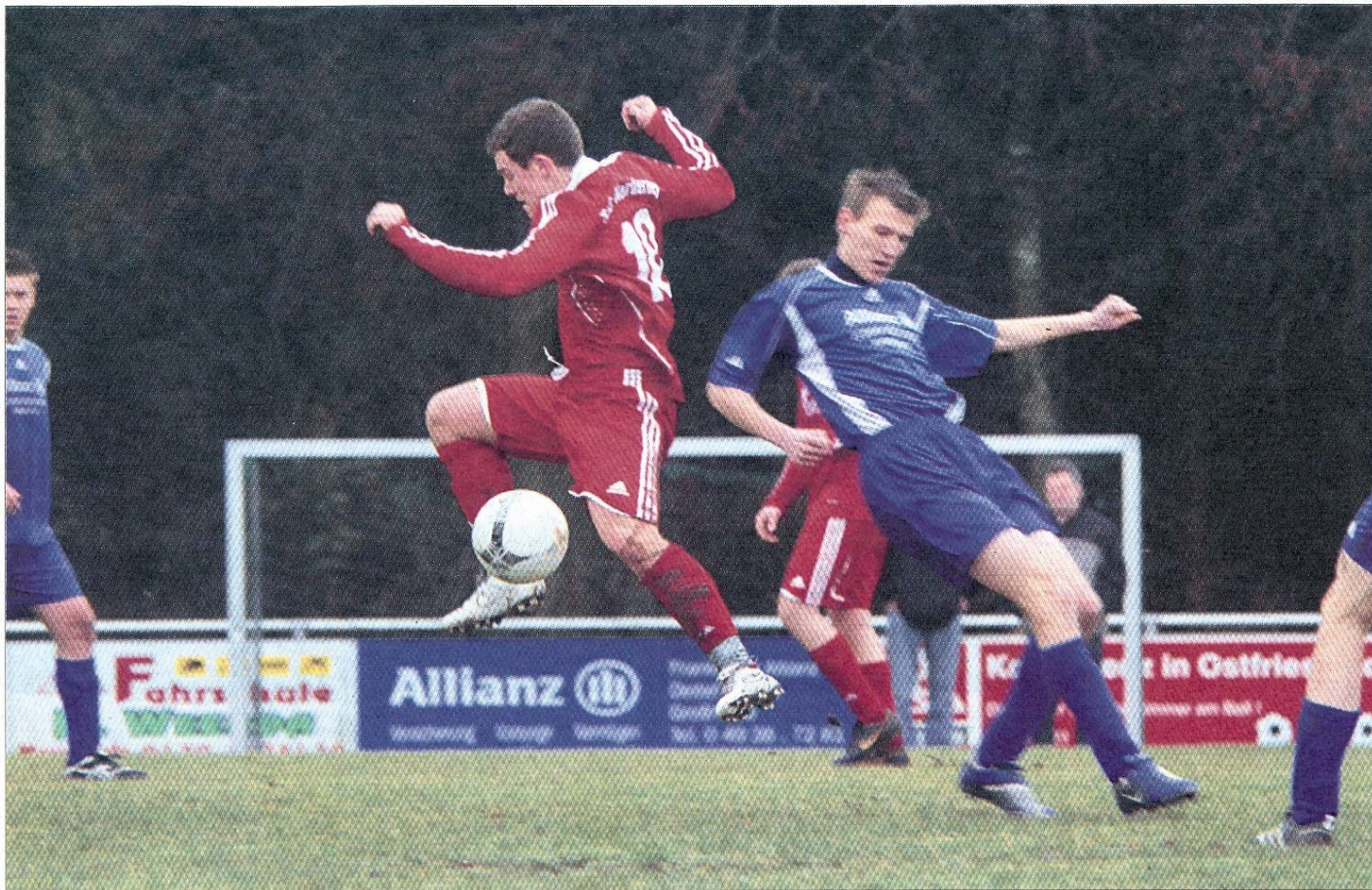
In der Kreisliga weht ein anderer Wind. Dennoch glauben die Fußballer von der Insel (rotes Trikot) an den Klassenerhalt.