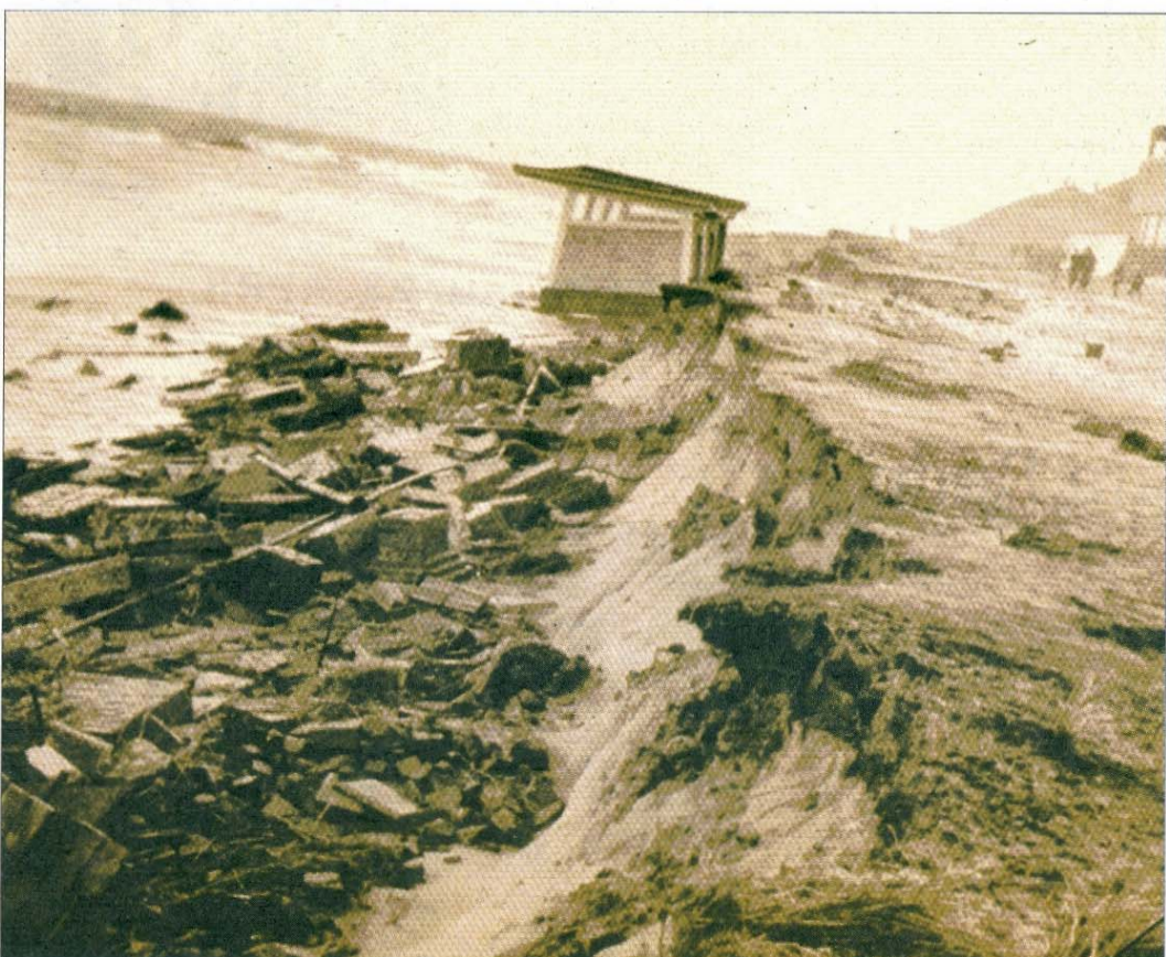
Die Entwicklung der Schäden vor der Georgshöhe (links, rechts und oben).