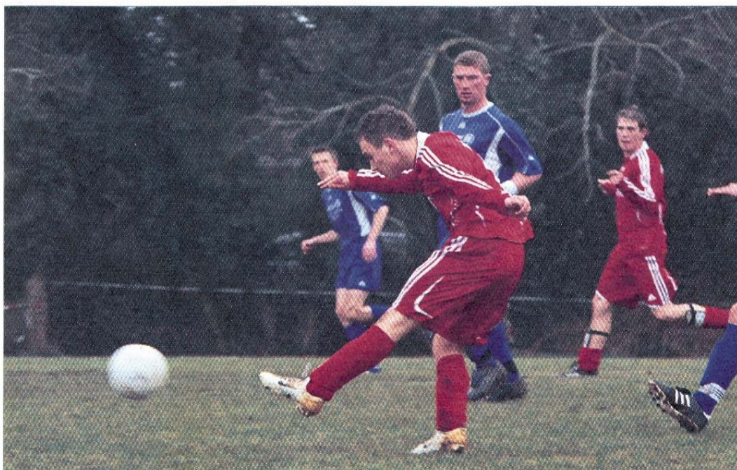
Schon jetzt steht fest, dass vier Spieler den TuS im Sommer verlassen werden.