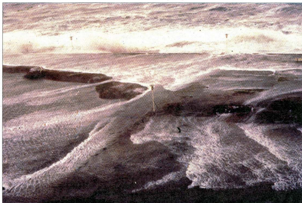
Wellenüberlauf vor der Kaiserstraße.