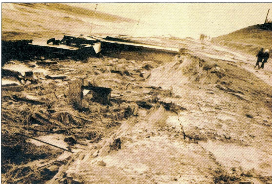
Schäden vor der Georgshöhe (siehe auch Fotos unten).